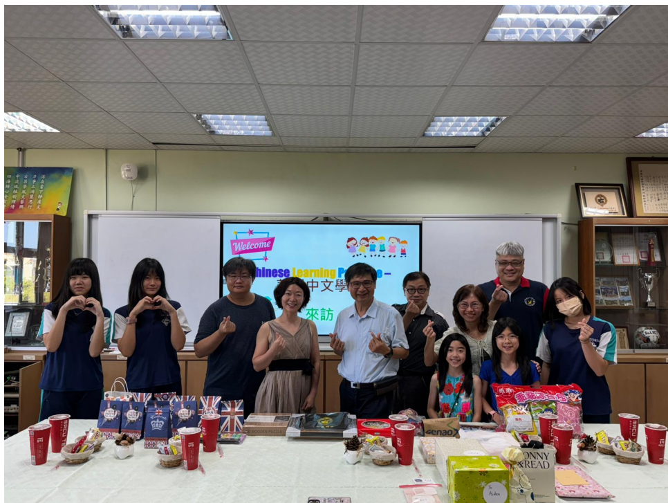
華園校長到右昌國中

第一次交流活動主題為「自我介紹」。GCSE班級老師引導九月剛升上GCSE的學生學習自我介紹的基本結構，並協助他們進行內容撰寫和句型修正。學生們的自我介紹內容包含姓名、學校與年級、喜歡的食物與興趣、最喜歡的科目或課外活動。本次活動特別結合節慶文化，學生們將自我介紹內容寫入學校的聖誕卡片，並從英國寄送回台灣右昌國中的學伴，透過手寫書信交流與文化分享。