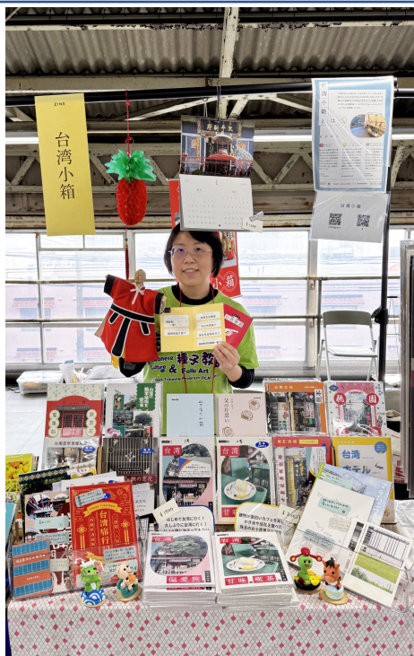
推廣臺灣華語跟文化