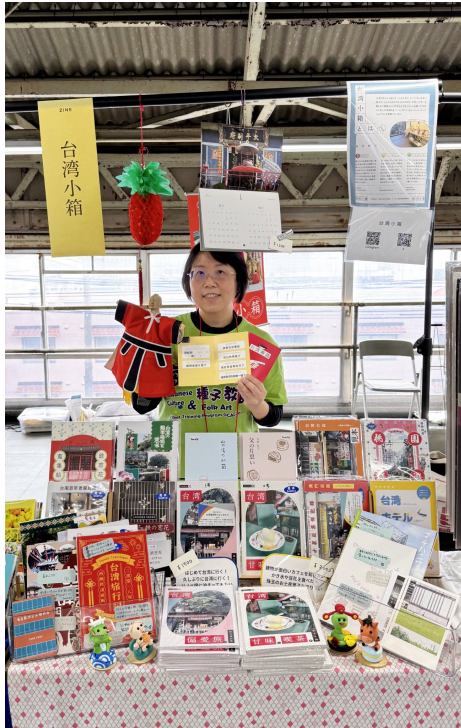
推廣臺灣華語跟文化