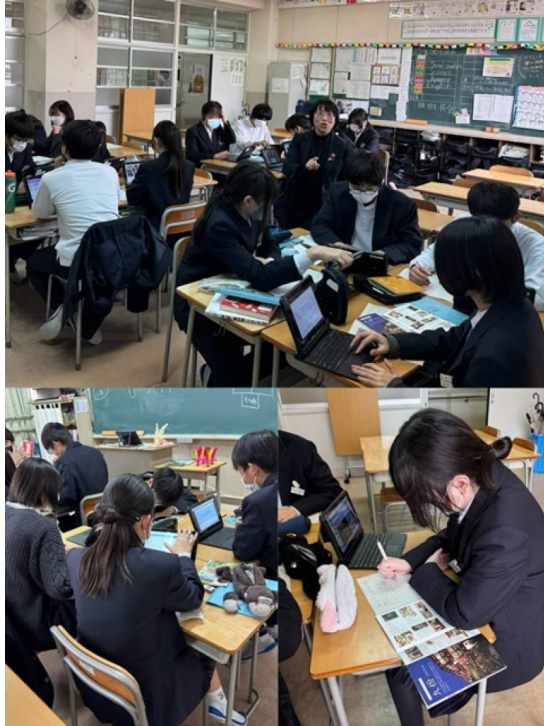
學生們進行分組，討論學到的臺灣文化