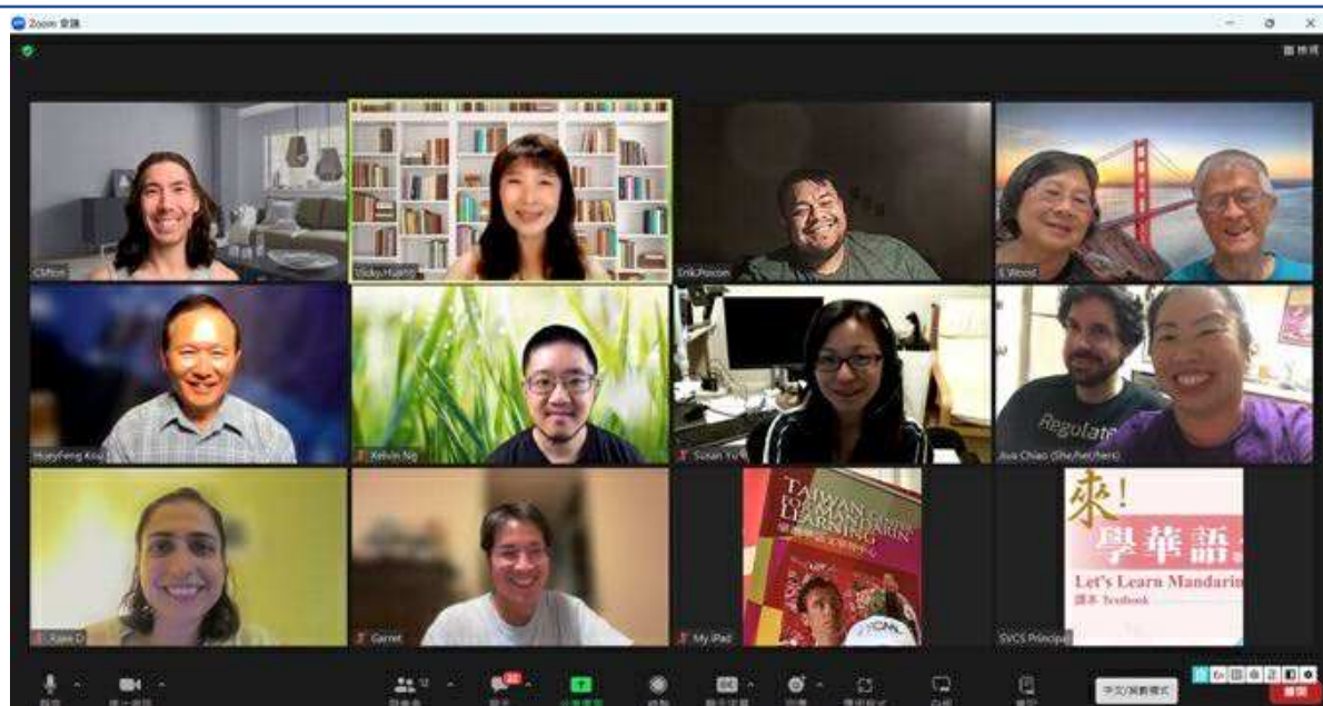
圖一：每週輔以數位線上課程