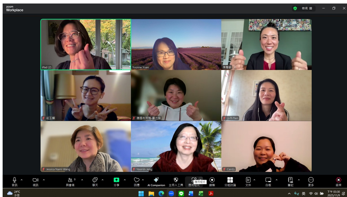
參與座談會的老師團體照