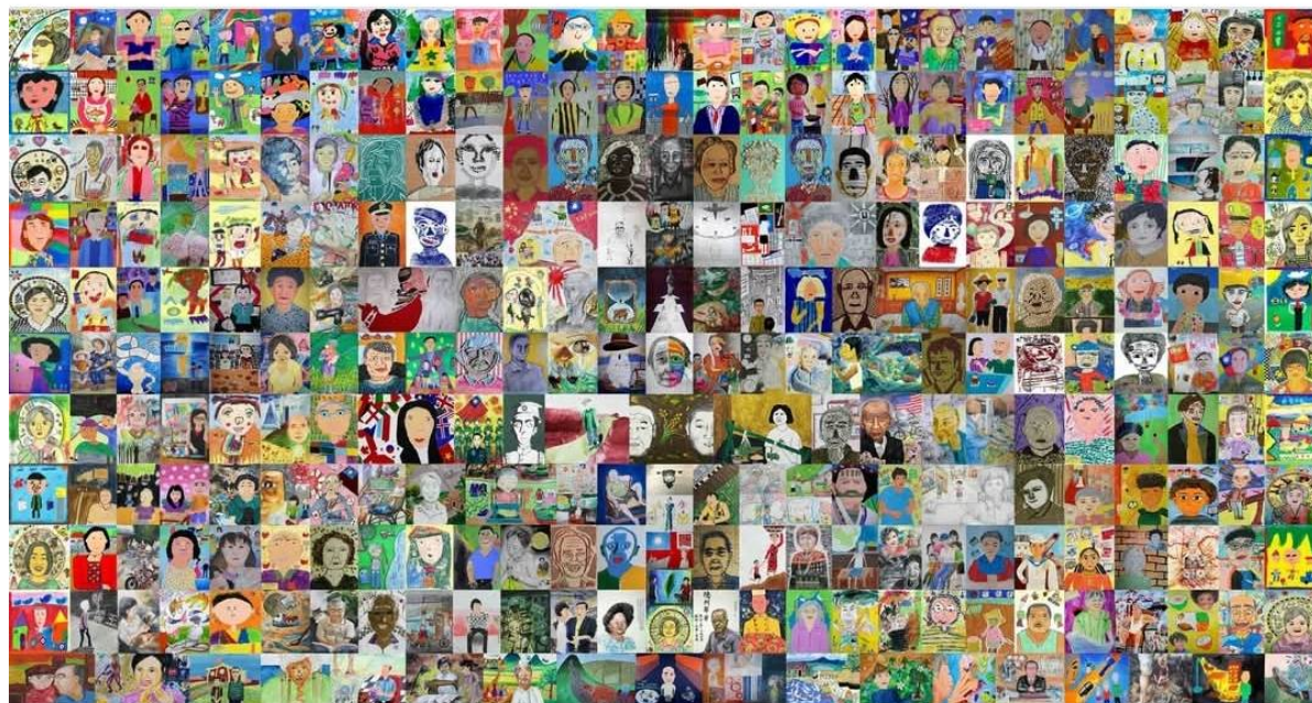
《給阿嬤的一封信》片尾群體創作圖