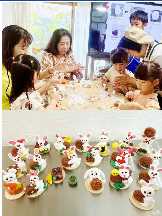
陳校長細心教導製作捏麵人