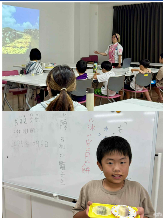
9月27日大阪市社區臺灣文化推廣活動