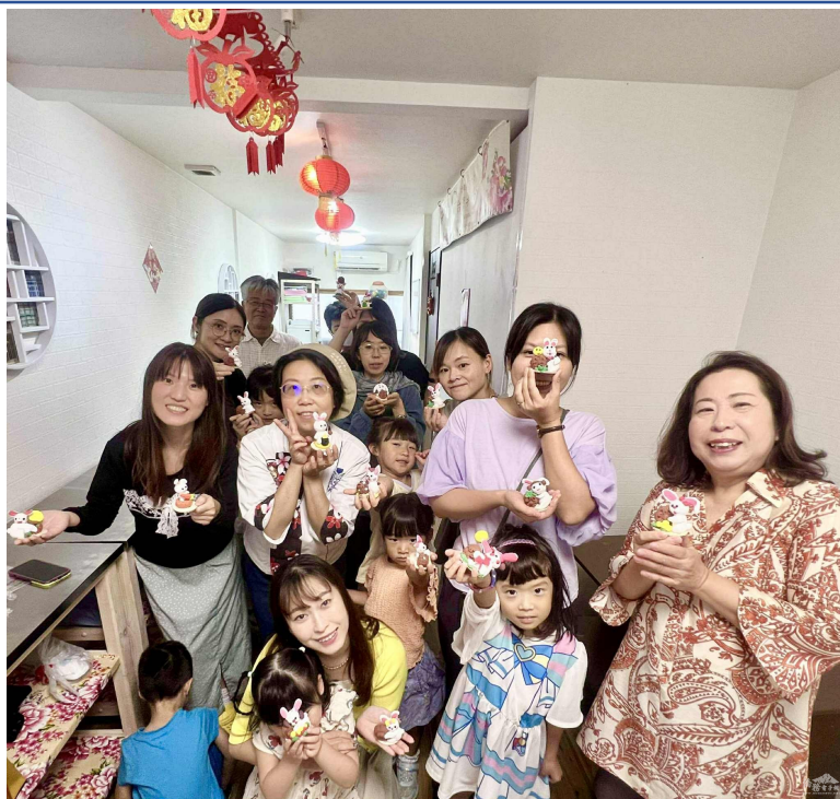
9月28日中秋節文化講座合照