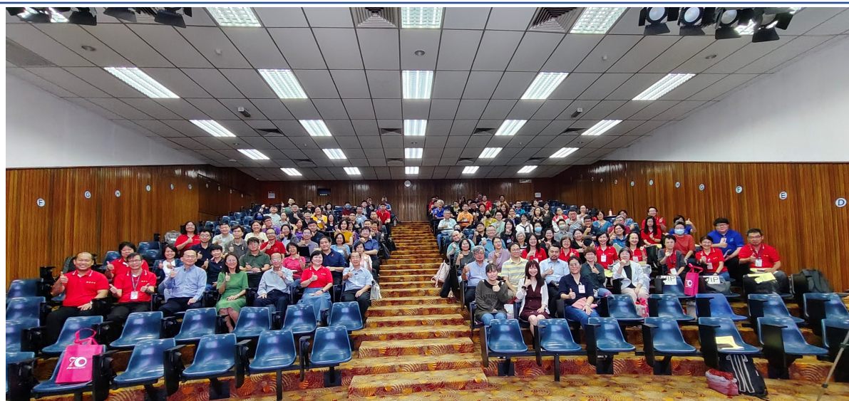
圖1：全體學員與講師合影留念