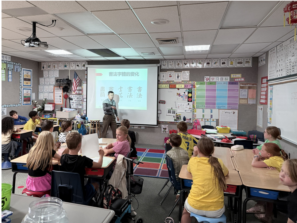
李理事向同學解說書法的字體變化