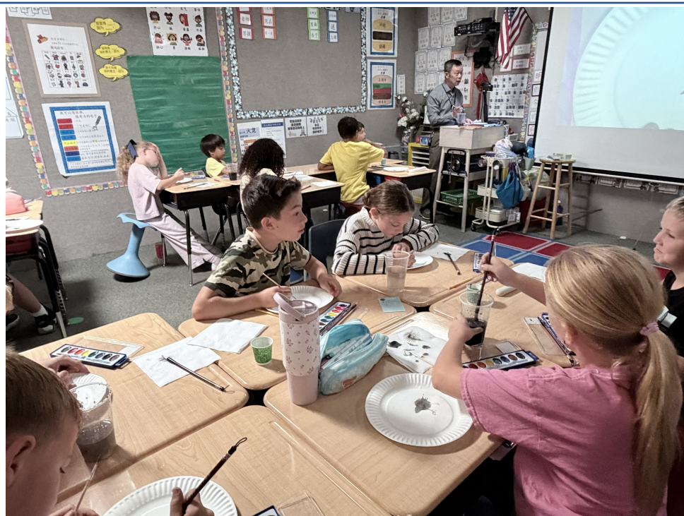
同學互相觀摩學畫