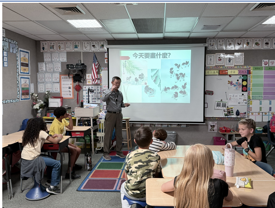
今天國畫的主題- 小雞