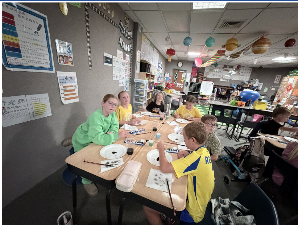
同學聚精匯神學書法國畫