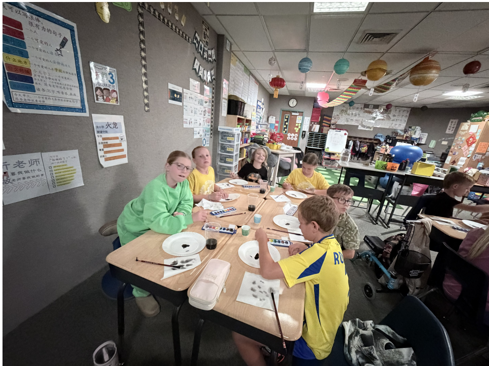
同學聚精匯神學書法國畫