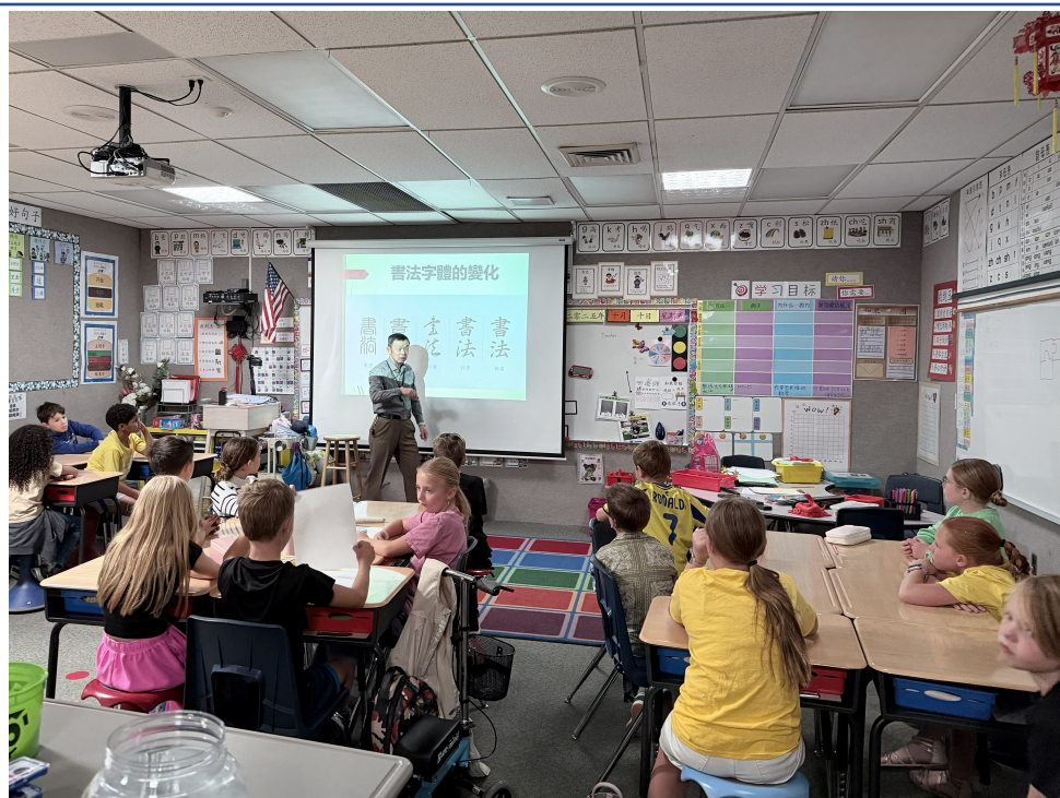
李理事向同學解說書法的字體變化