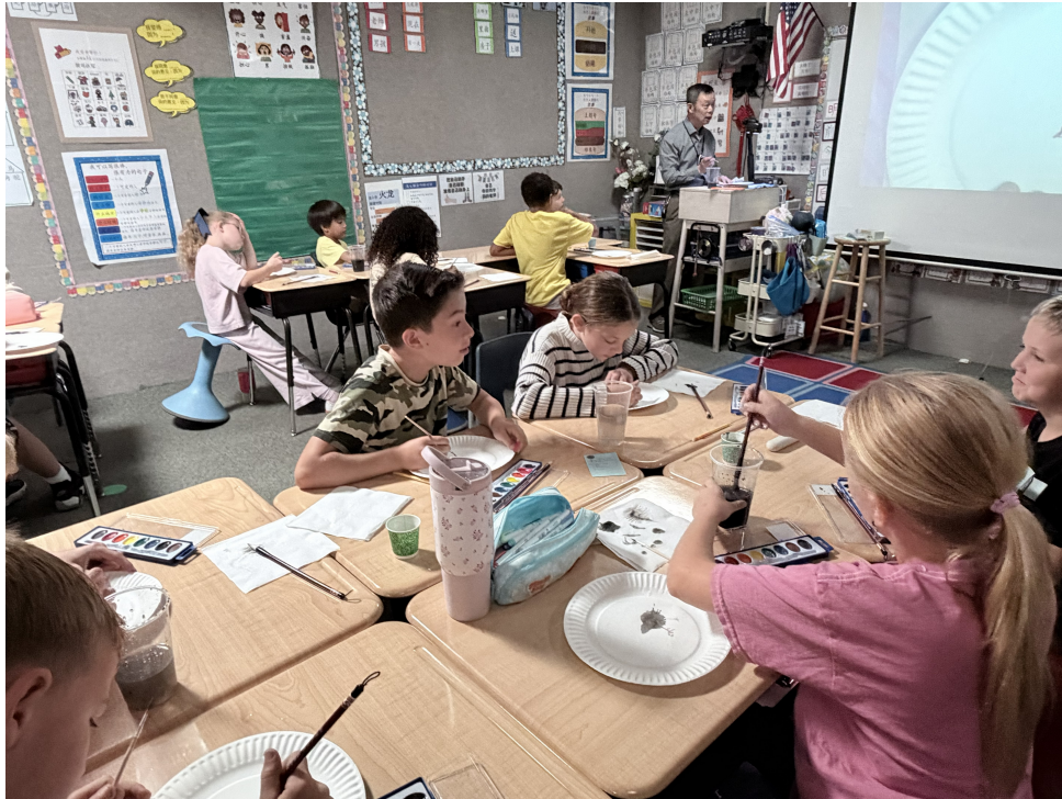
同學互相觀摩學畫