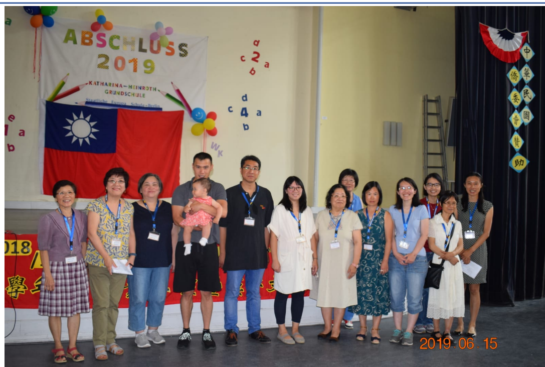
柏林中文學校全體老師