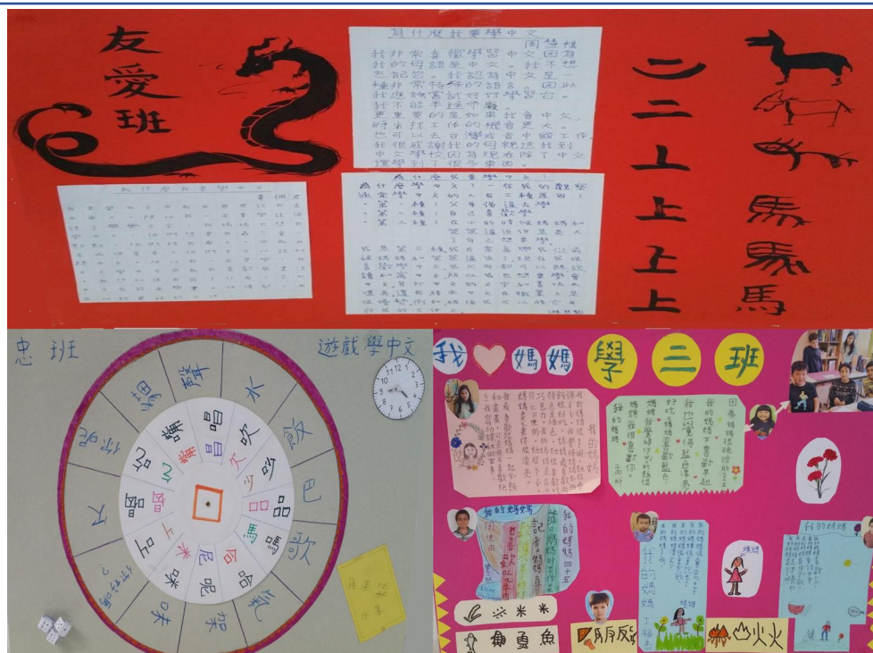
壁報比賽一，二，三名