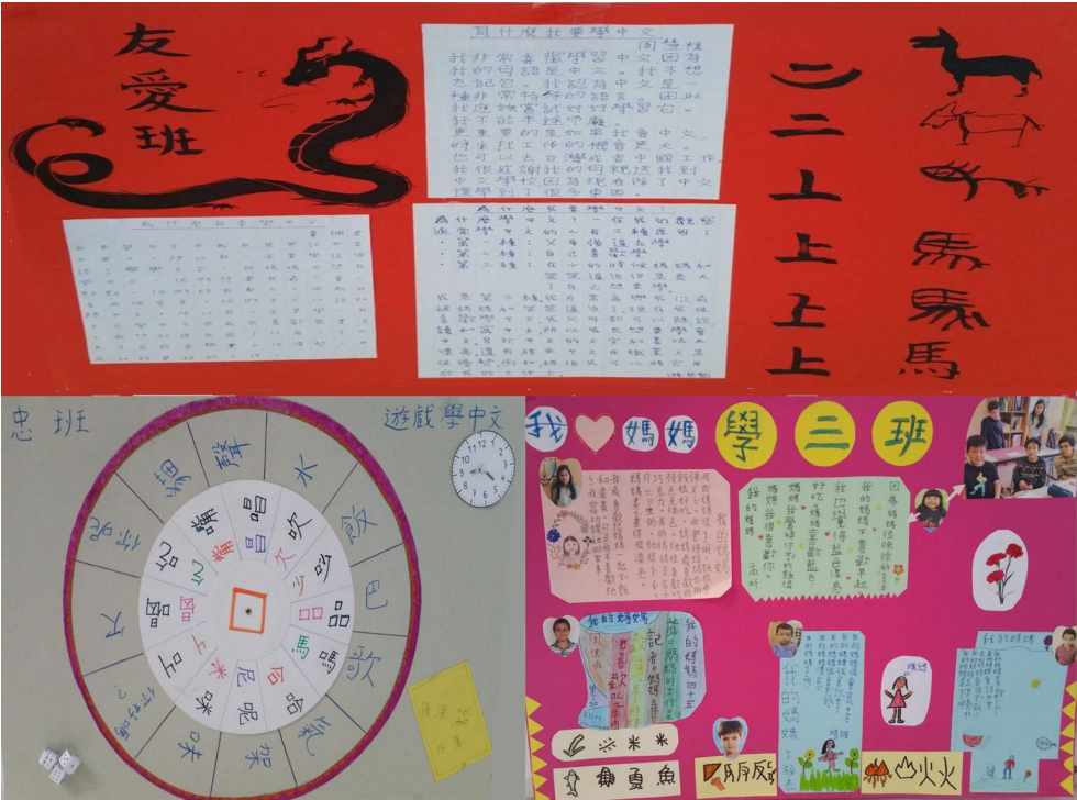
壁報比賽一，二，三名