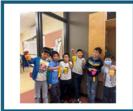
各班學生作品展示與合影。