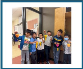
各班學生作品展示與合影。