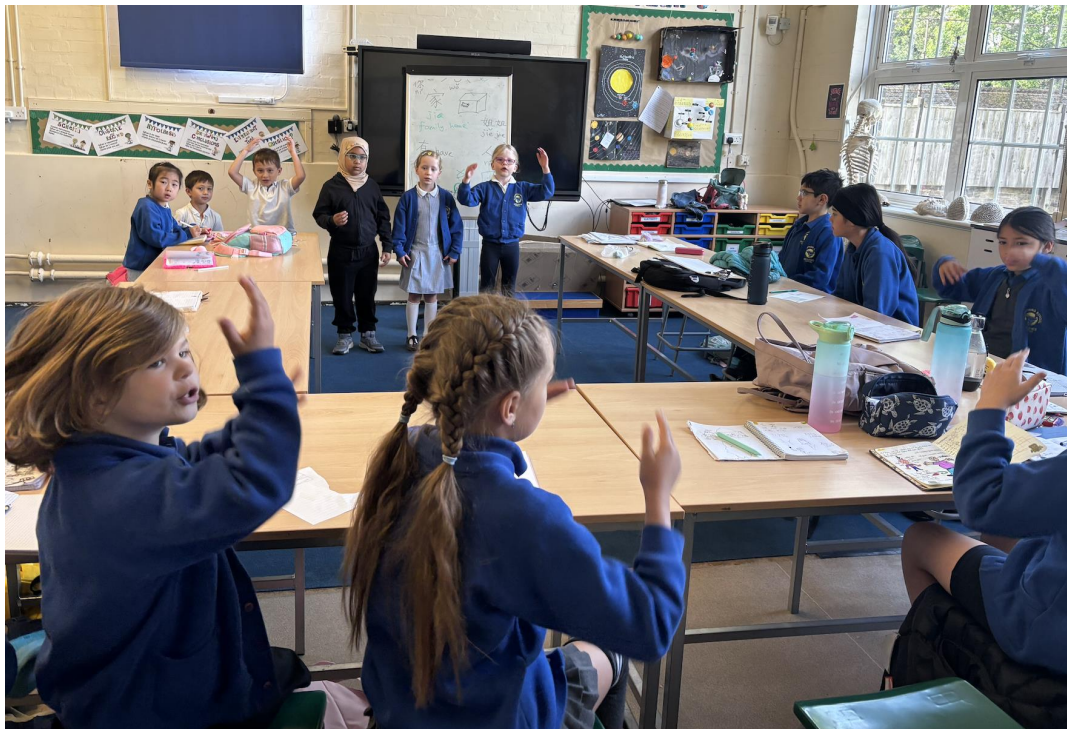
學生們同時學習了舞台表演技巧與即興創作，在實踐中培養自信與表達能力。

本次暑期五週營隊圓滿完成，不僅讓學生在沉浸式環境中快樂學習中文，更透過跨領域主題活動，培養了藝術素養、科技探索力、自然觀察力、表演自信與音樂欣賞力。未來學校將持續結合語言與文化，提供更多元的學習機會，幫助學生在中英文之間靈活運用，拓展國際視野。