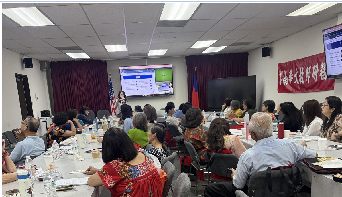
教師出席踴躍專心聆聽