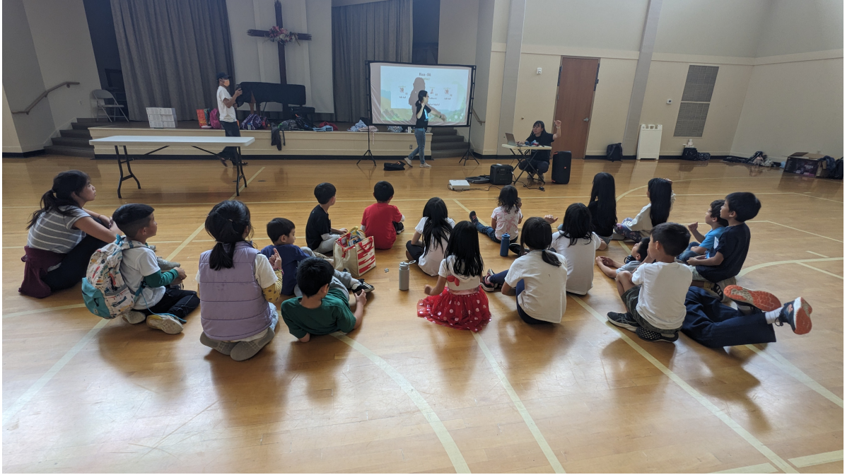
囡仔認真學習台語囡仔歌