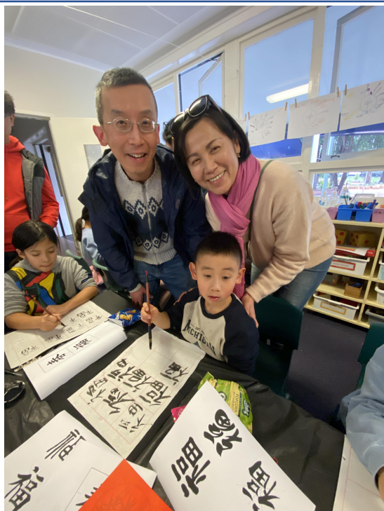
父母親都來會場協助指導同學書寫毛筆字