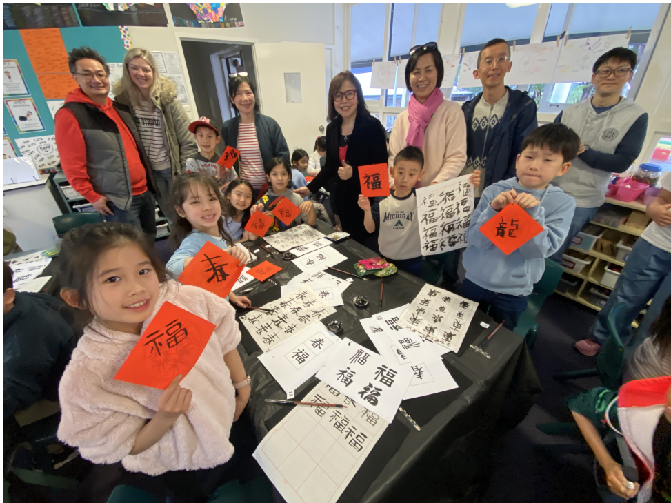
二年級同學也表現不俗，完成春聯的「春」、「福」、「龍」