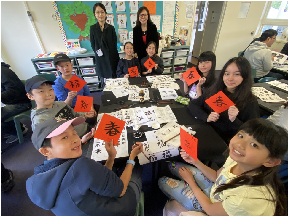
中高年級同學最後完成春聯的「春」及「福」字