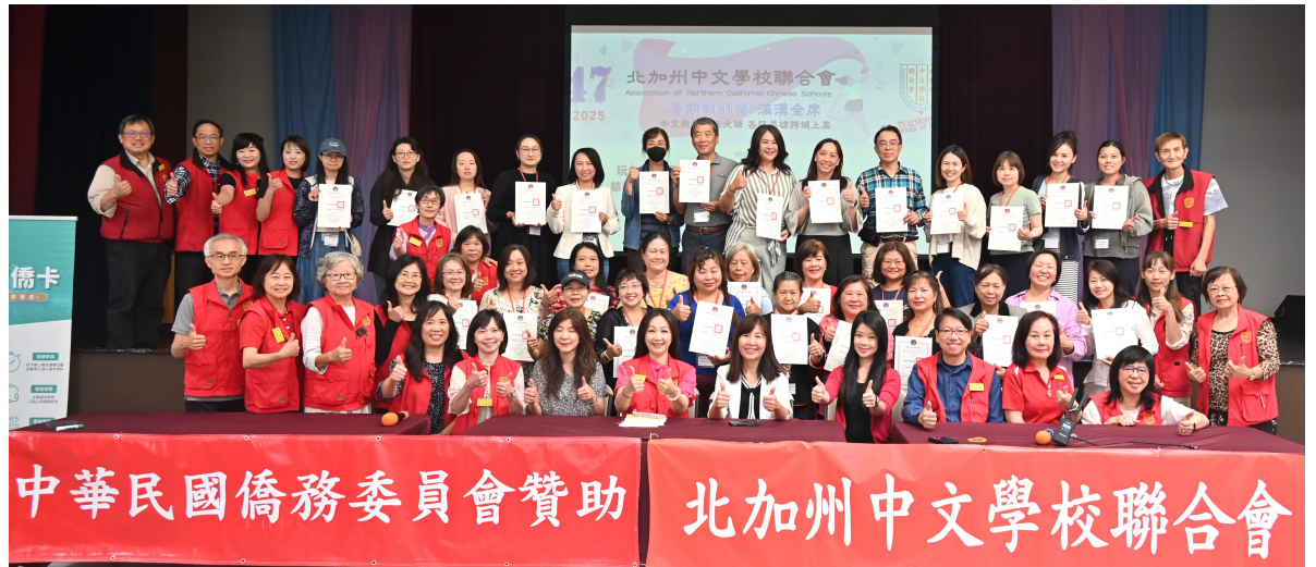
七月二十日 「北加州中文學校聯合會」暑期教師研習班結業式大合照