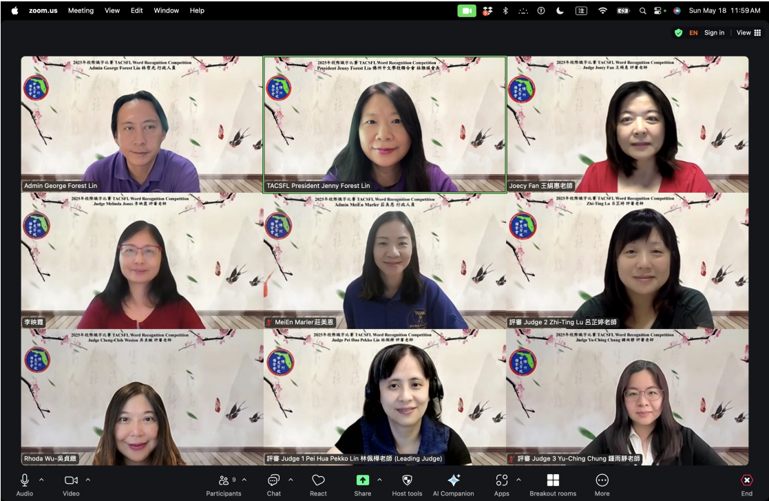
識字比賽的評審老師及行政人員