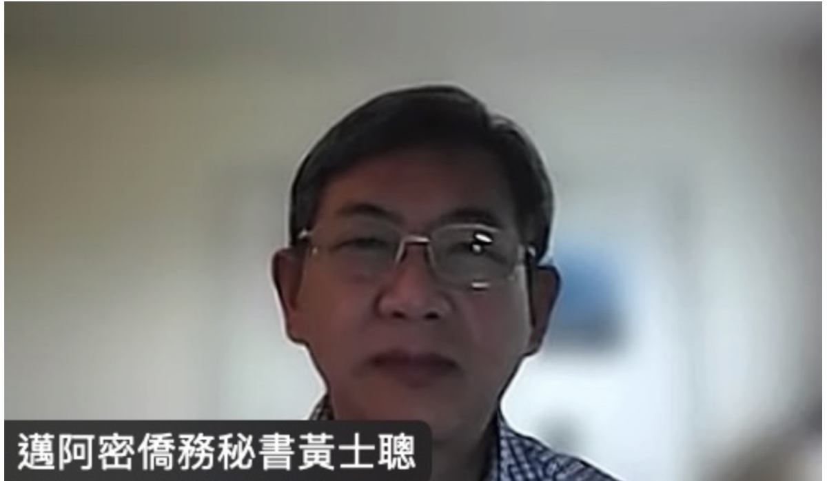
邁阿密僑務秘書黃士聰