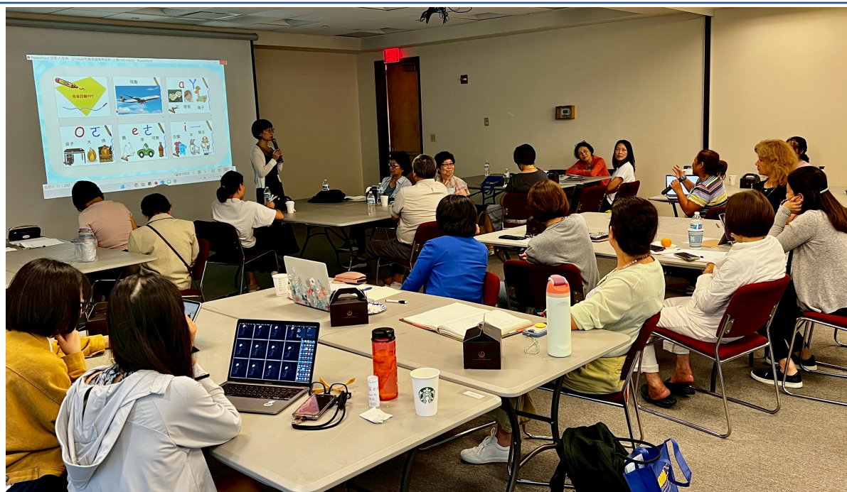
參與學員適時發問交流