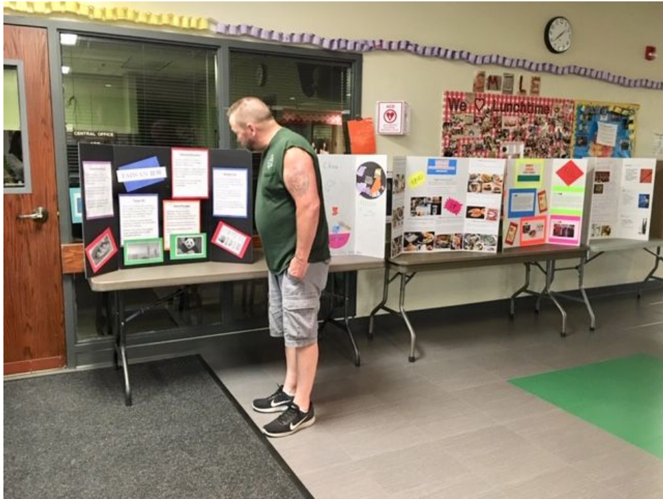
展示供主流人士觀摩