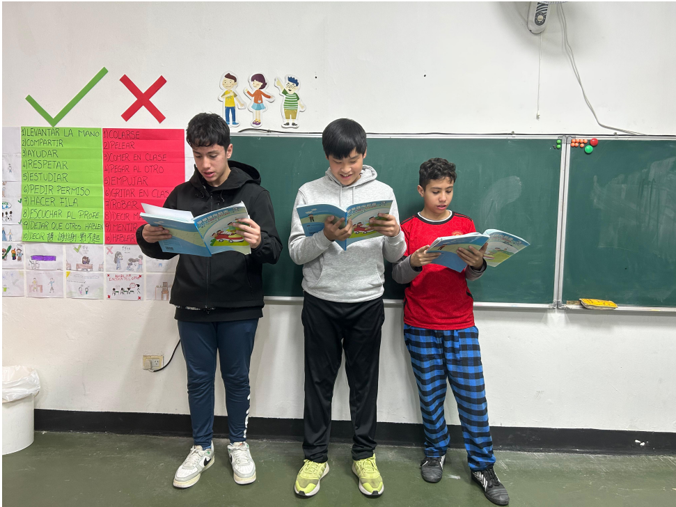
華語部認字朗讀活動3