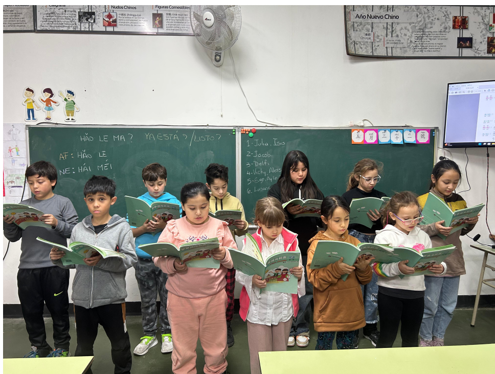
華語部認字朗讀活動4