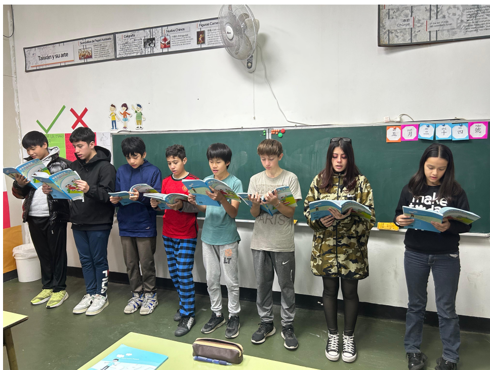
華語部認字朗讀活動1