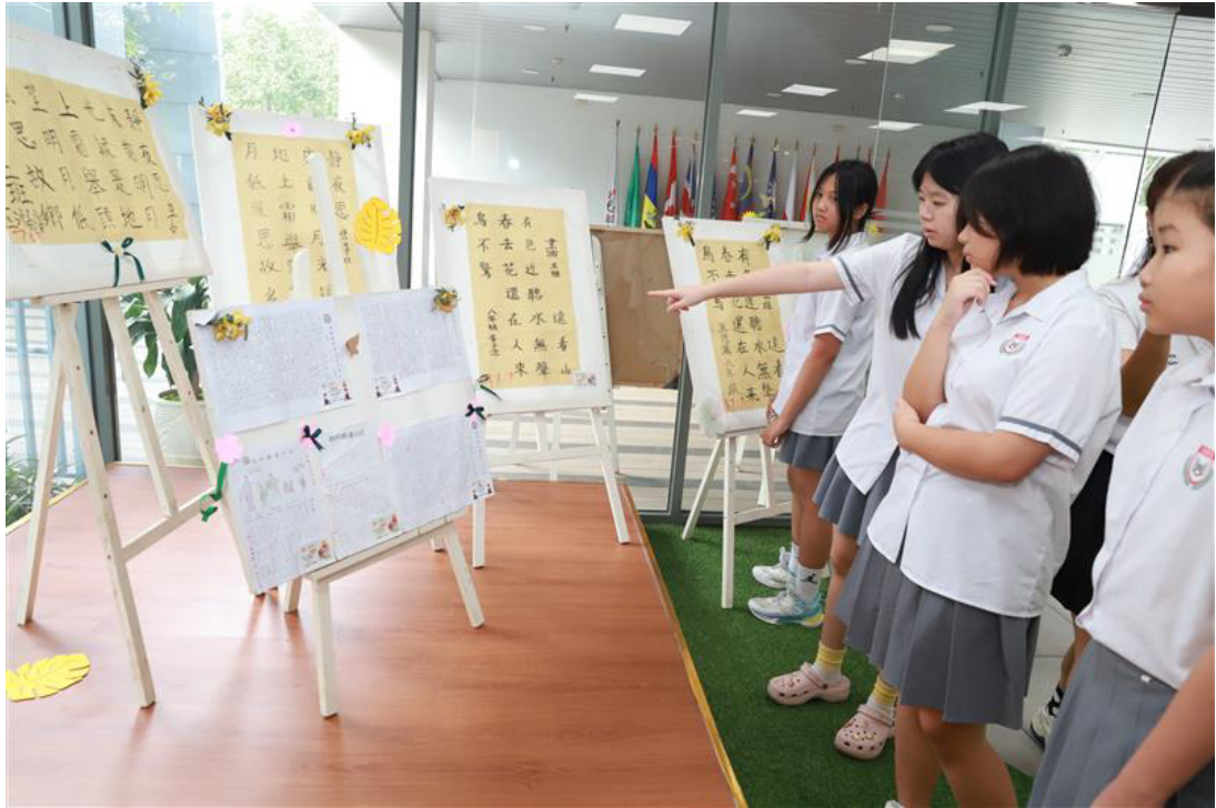
得獎作品展覽會場