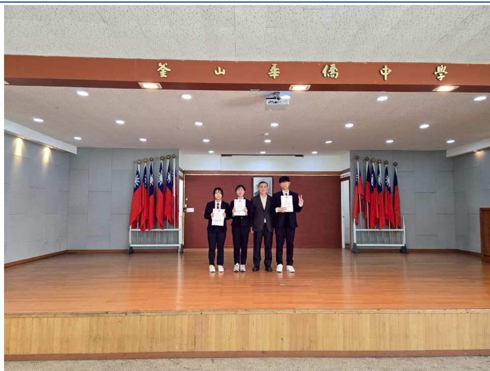
釜中藏字：漢字大師爭霸戰-高中部頒獎