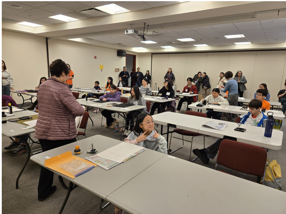
WMACS 書法比賽 1