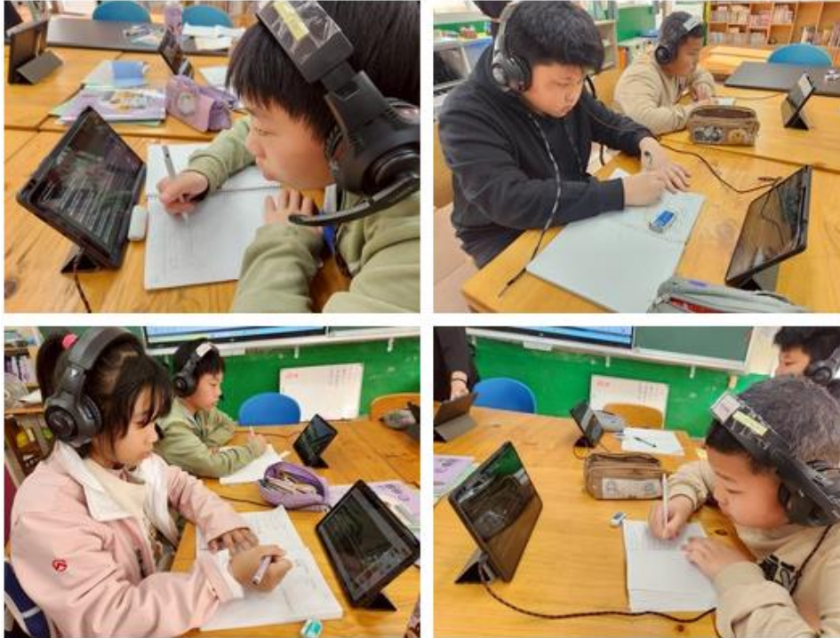
坪林國小英文視訊群