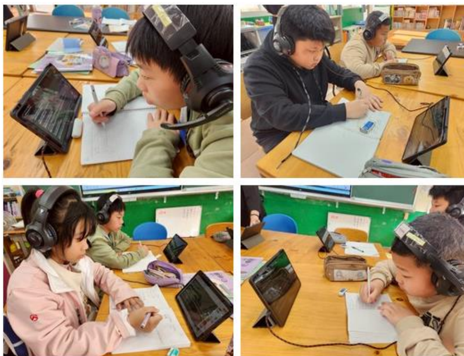
坪林國小英文視訊群