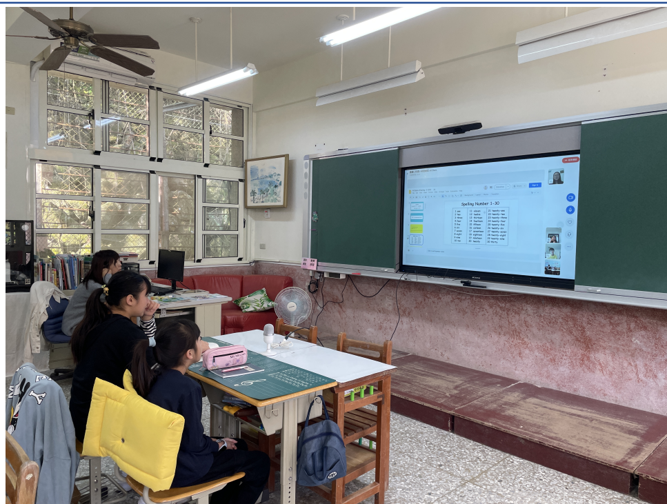
嘉義仁和國小英語會話