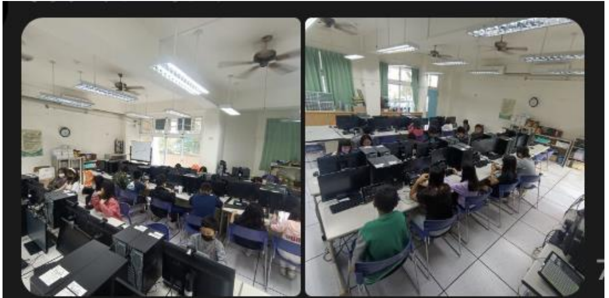
高雄甲仙國小英語會話