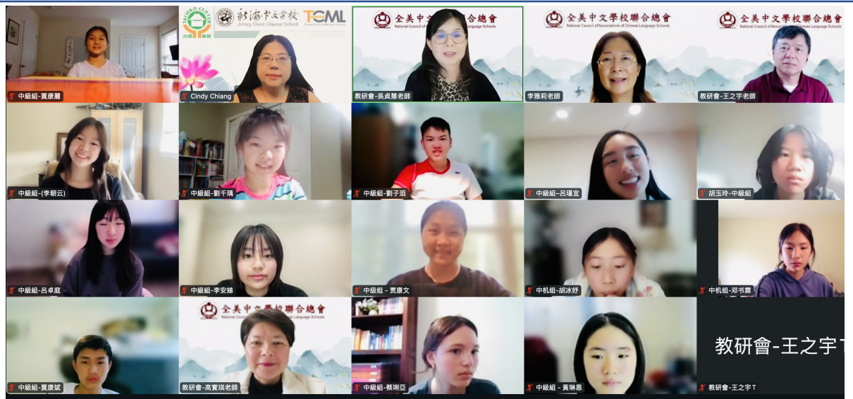
中級組學生比賽合影