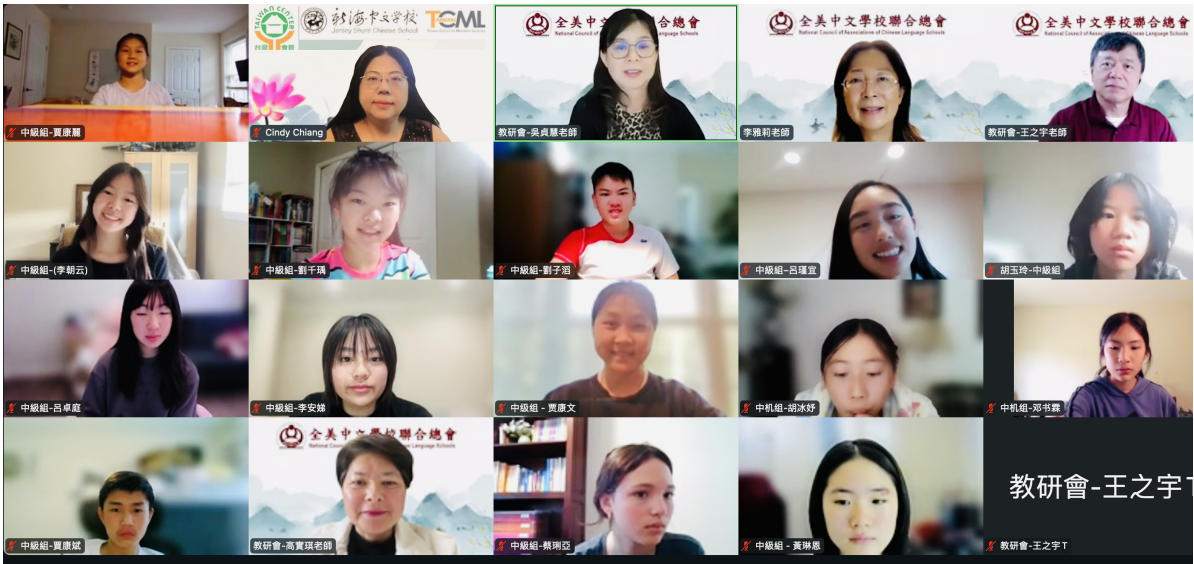
中級組學生比賽合影