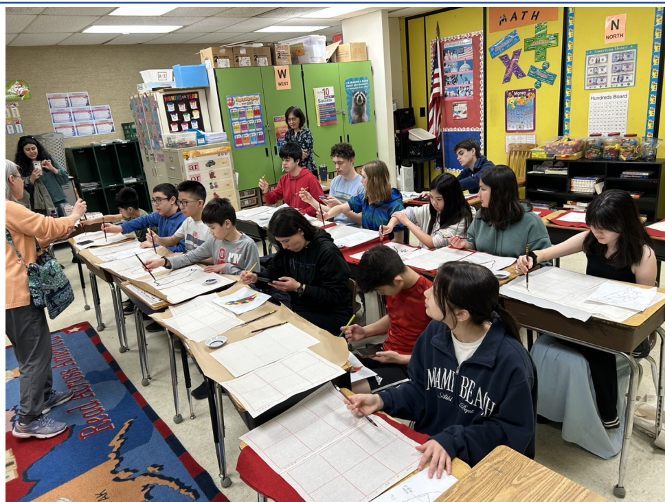
CSL進階班 班級內演講比賽