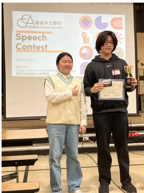
全校性演講比賽 高年級組第一名