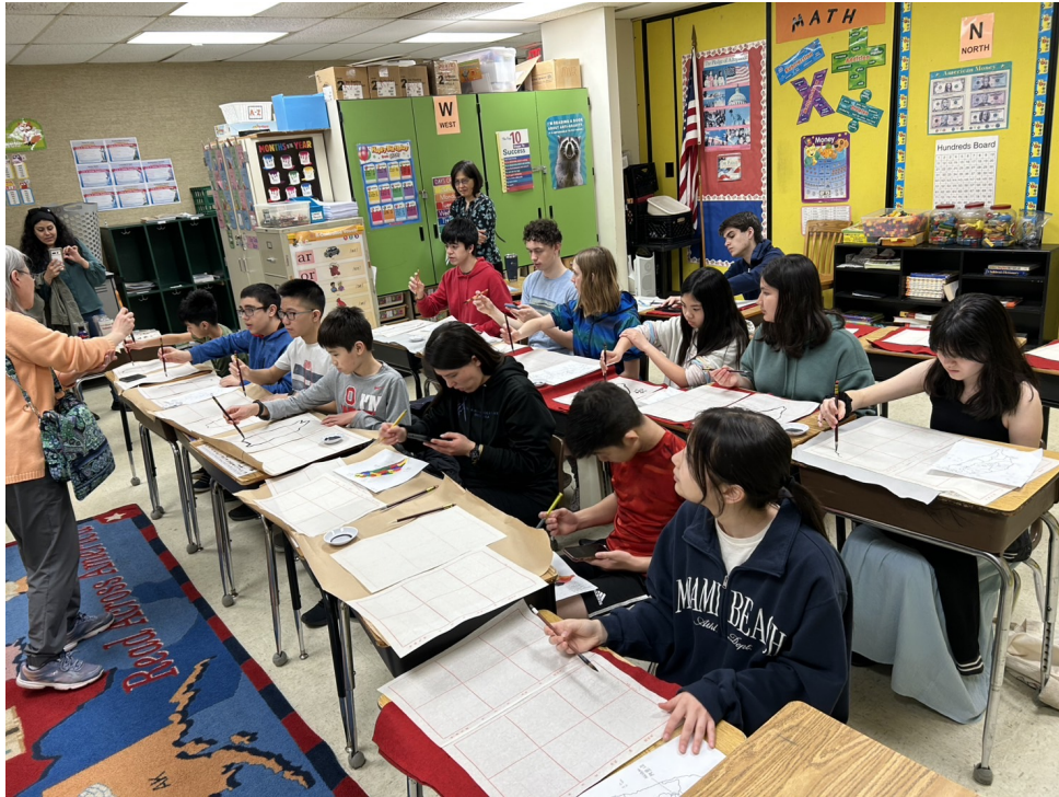
CSL進階班 班級內演講比賽