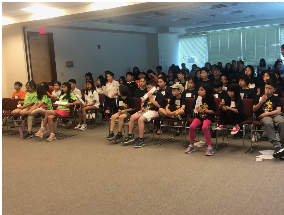
參賽同學家長專心觀賽