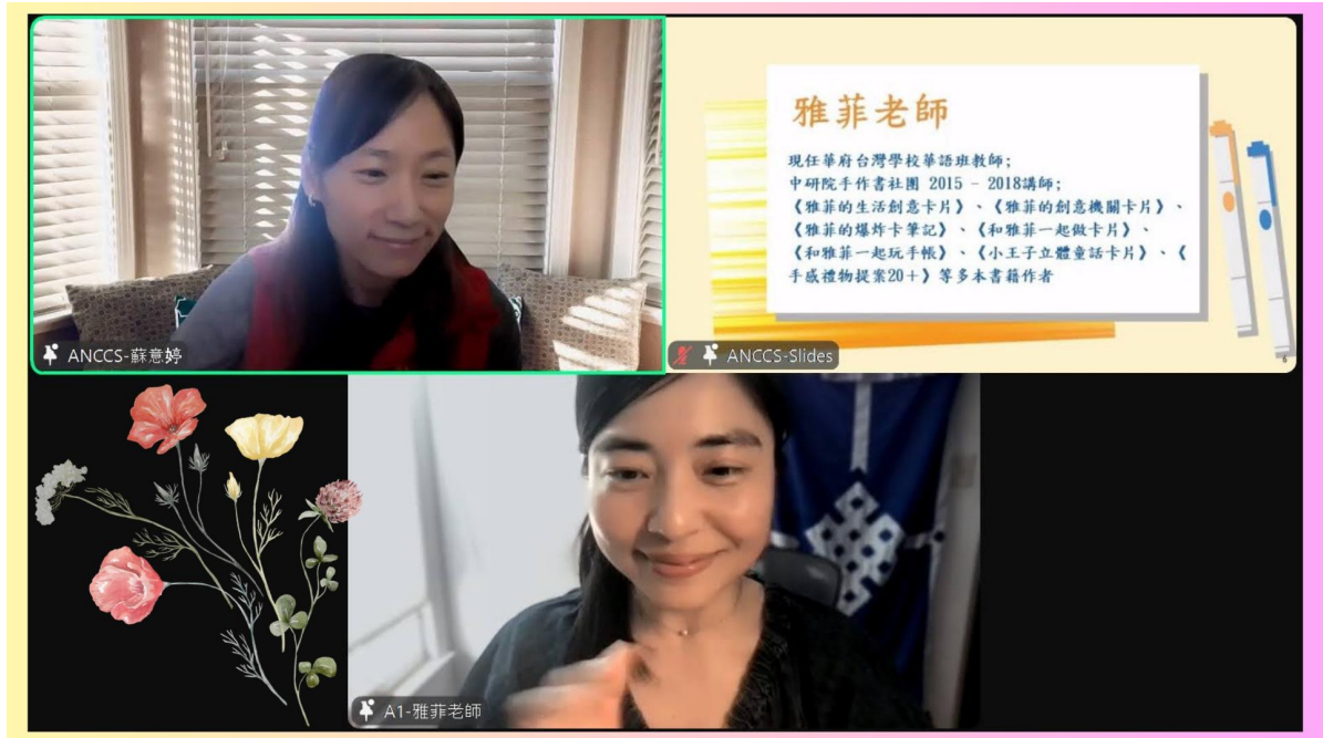
來自華府的雅菲講師 「AI 助攻！用 ChatGPT + PPT 打造創意華語教材」