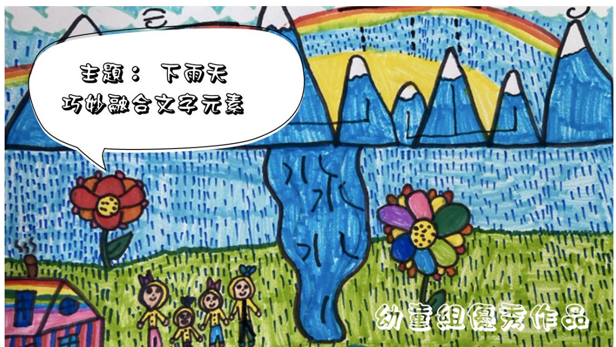
溫哥華菁英中文學校舉辦「詩情畫意 字趣飛揚」創作比賽1

感謝僑委會贊助協助推廣，本校將持續透過多元活動深化學生對中文的熱愛與理解，讓語文學習與文化傳承自然融入生活。