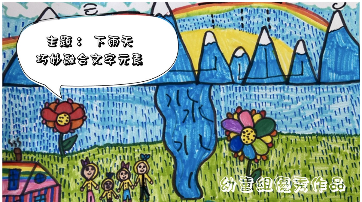
溫哥華菁英中文學校舉辦「詩情畫意 字趣飛揚」創作比賽1

感謝僑委會贊助協助推廣，本校將持續透過多元活動深化學生對中文的熱愛與理解，讓語文學習與文化傳承自然融入生活。