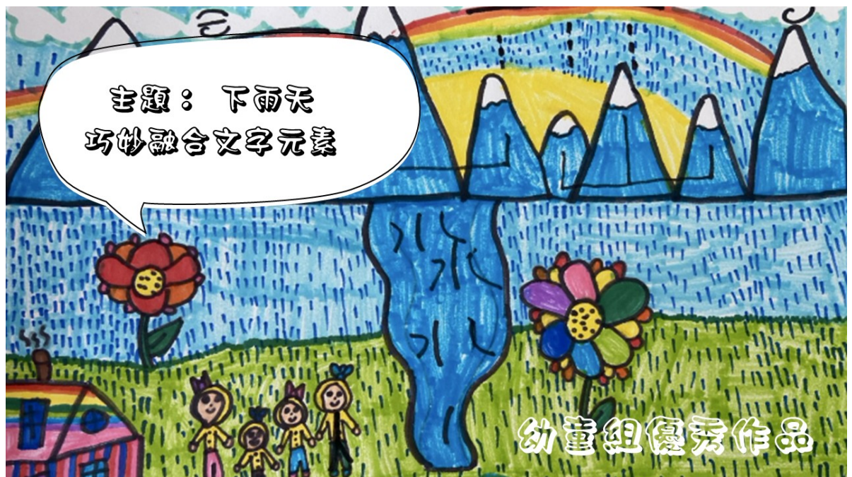
溫哥華菁英中文學校舉辦「詩情畫意 字趣飛揚」創作比賽1

感謝僑委會贊助協助推廣，本校將持續透過多元活動深化學生對中文的熱愛與理解，讓語文學習與文化傳承自然融入生活。