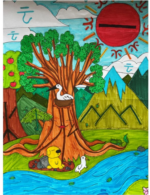
溫哥華菁英中文學校舉辦「詩情畫意 字趣飛揚」創作比賽6