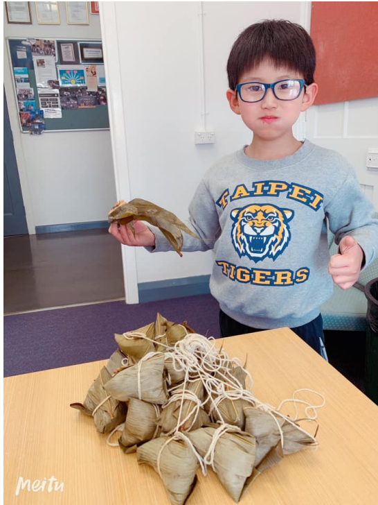
澳洲慈濟人文學校 2019端午節5