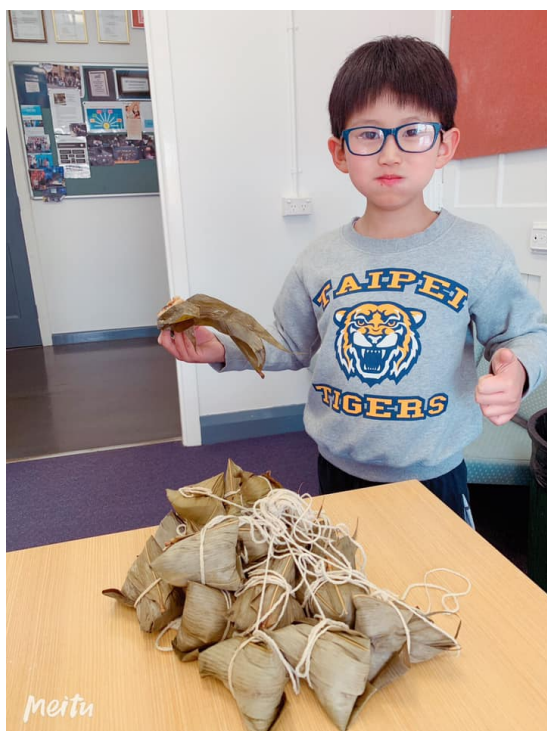
澳洲慈濟人文學校 2019端午節5