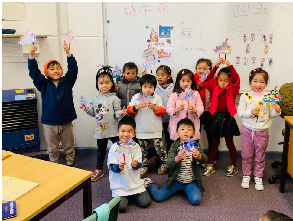
澳洲慈濟人文學校 2019端午節1

同時藉由實務教學，讓學生親自動手繪製龍舟、體驗製作香包及粽子等，並以賽龍舟遊戲競賽方式，提升活動樂趣，同時教導高年級學生如何製作完美三角形比例的傳統端午節粽子，期待透過實務教學，加深學生對民俗文化之認識，讓中華文化能在海外繼續落實和傳承。