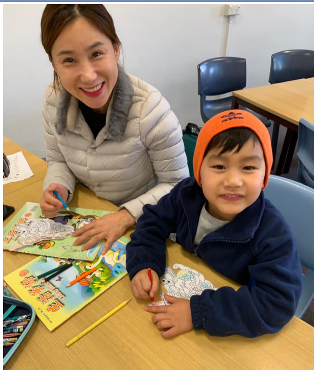
澳洲慈濟人文學校 2019端午節4