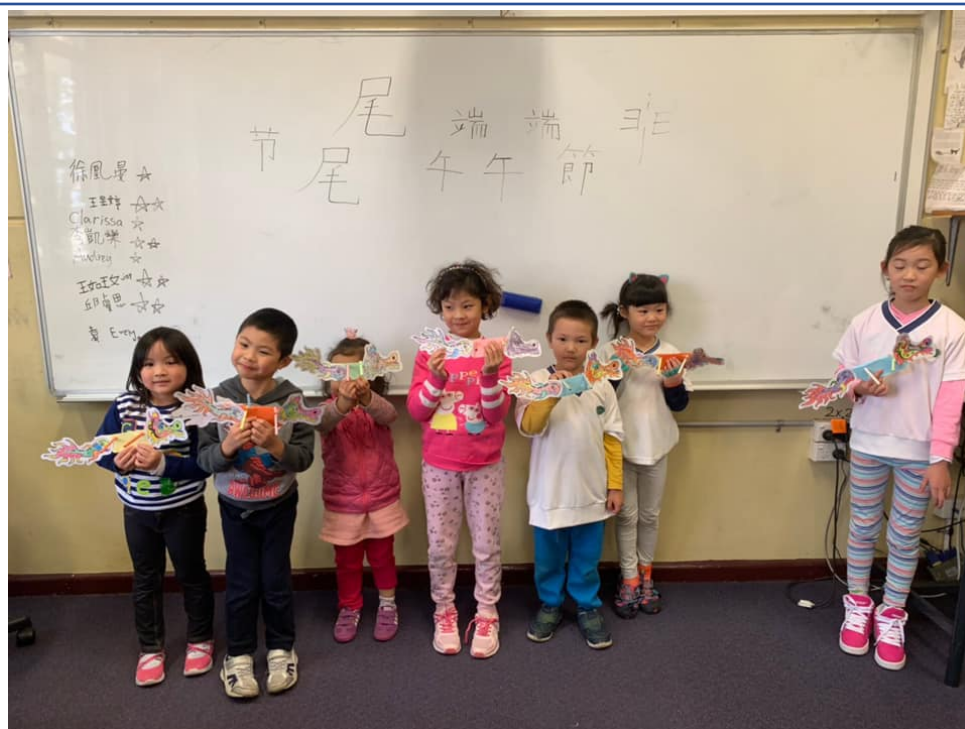
澳洲慈濟人文學校 2019端午節2