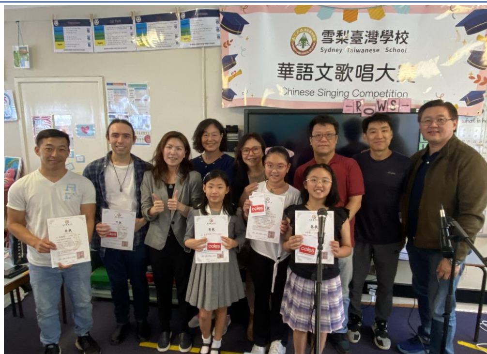
各組參賽者表現亮眼