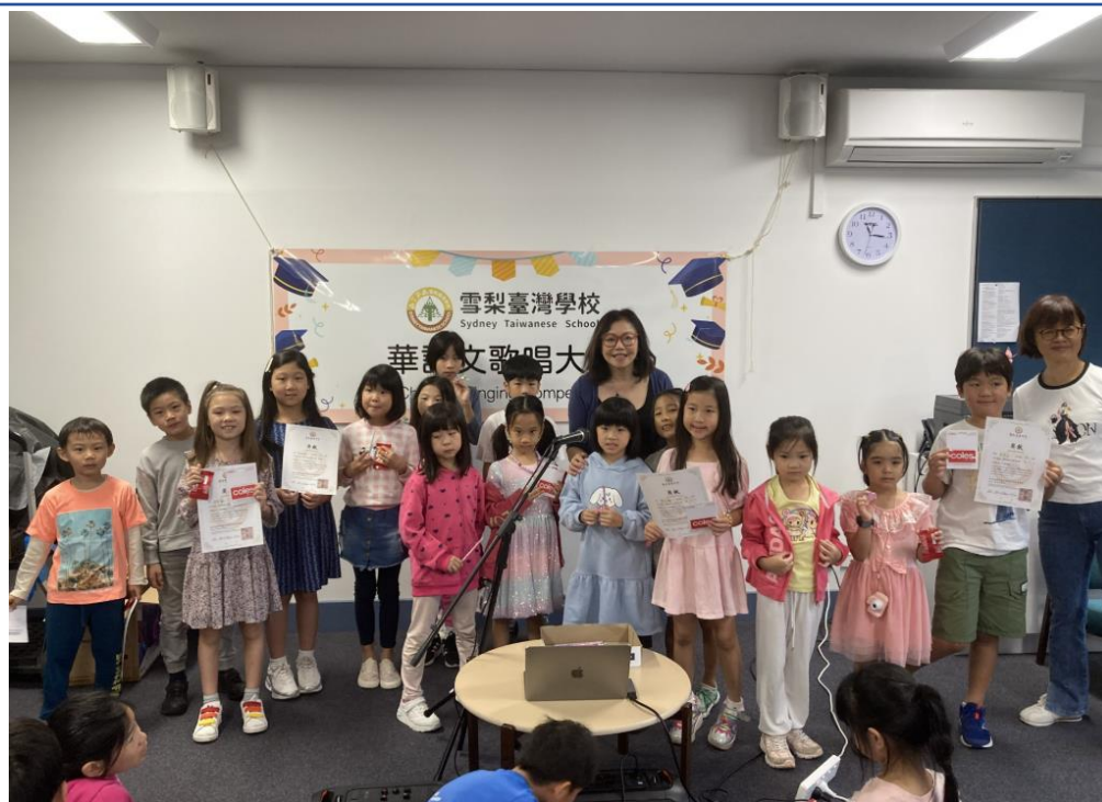
參賽者展現自信，為表演加分