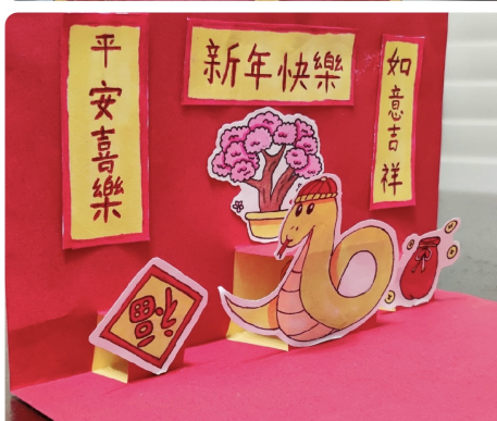
得獎作品集 - 呈現學生的精心構思