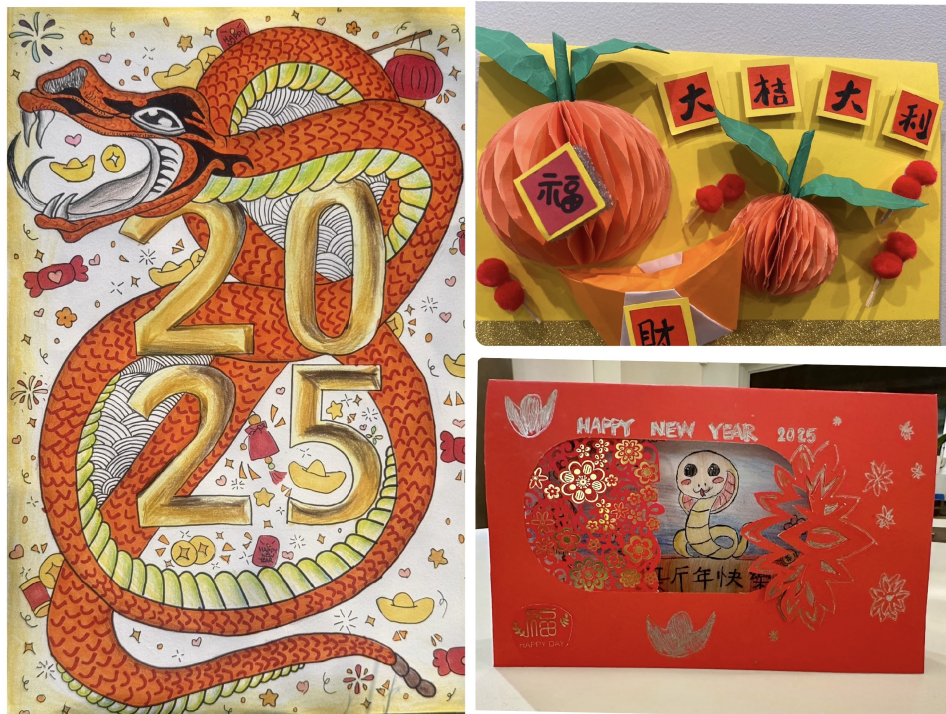
得獎作品集 - 呈現學生的精心構思

全美中文學校聯合總會會長王婉君感謝長程規劃委員會的精心統籌規劃，從前期準備到活動落幕，共耗時三個月。王婉君表示，賀年卡設計比賽激發學生們的創作熱情，未來全美總會將持續舉辦更多活動，為中華文化在美國的傳播與發展搭建更廣闊的平臺。