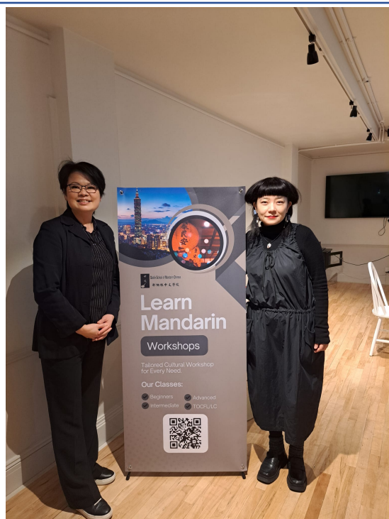
都柏林中文學校校長和陳繪彌導演