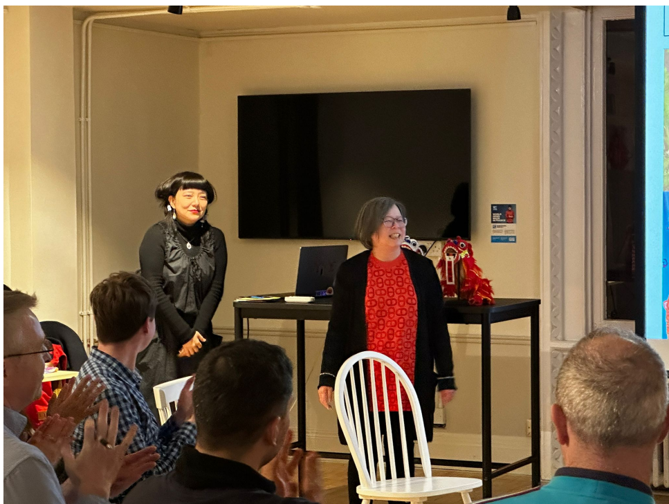
都柏林中文學校董事會長開場致辭