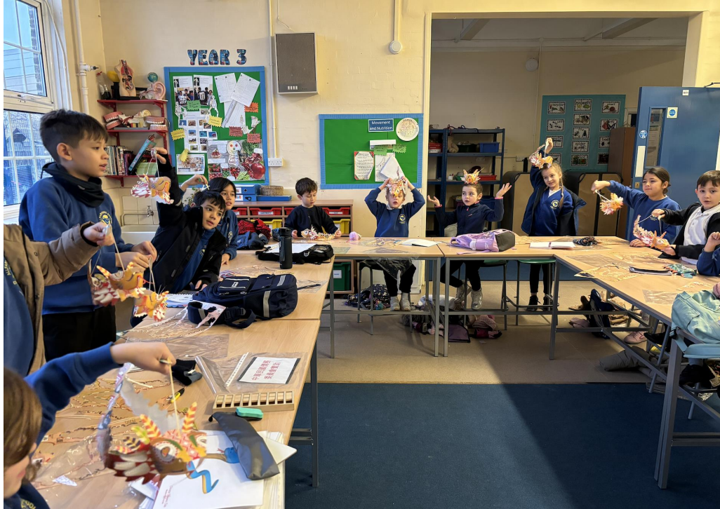
泰晤士中文學校：2025農曆新年寫作朗讀及剪紙遊戲比賽6