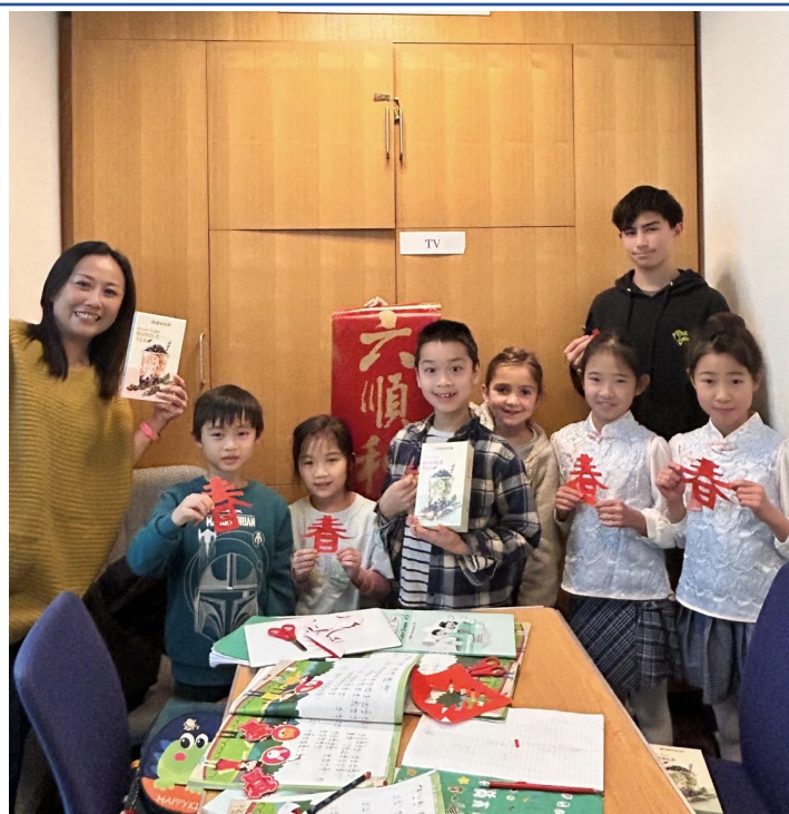
泰晤士中文學校：2025農曆新年寫作朗讀及剪紙遊戲比賽2