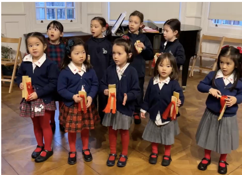
泰晤士中文學校：2025農曆新年寫作朗讀及剪紙遊戲比賽1

最後，通過展示獲獎作品與心得分享，學生們獲得了自我認同與成就感。活動不僅為學生提供了多元化的學習機會，還激勵他們探索更多與文化和語言相關的知識，為未來的學習與成長奠定了堅實基礎，充分體現了泰晤士中文學校致力於推廣中文教育與文化傳承的使命與價值。