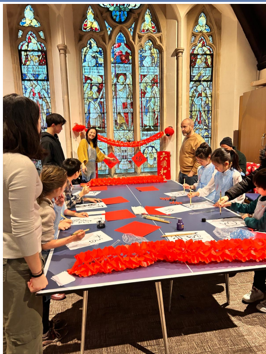
泰晤士中文學校：2025農曆新年寫作朗讀及剪紙遊戲比賽4