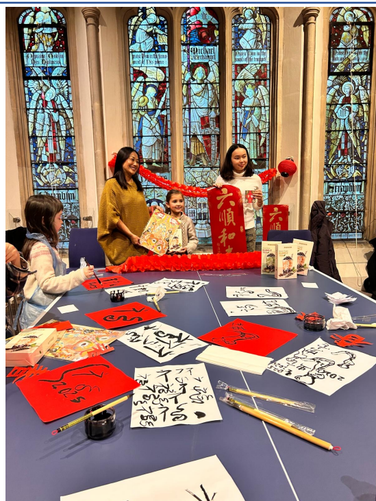
泰晤士中文學校：2025農曆新年寫作朗讀及剪紙遊戲比賽3