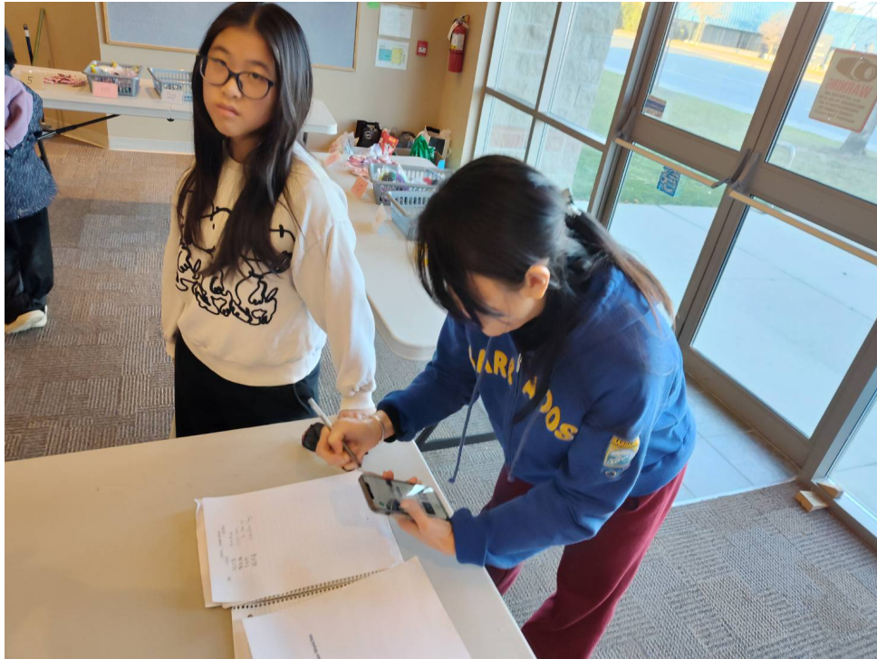
家長填寫i僑卡申請