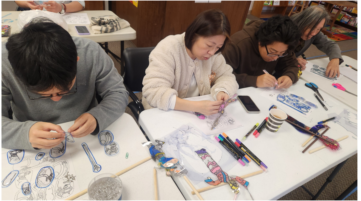
北卡洛麗中文學校2024皮影戲文化研習會2