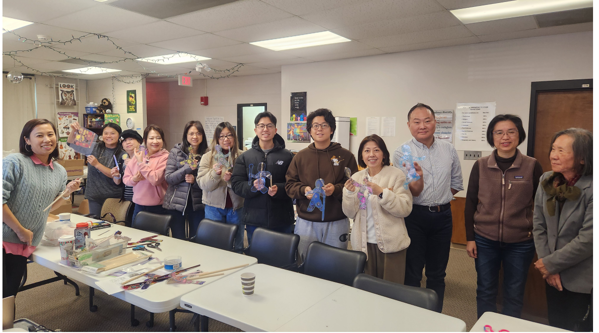
北卡洛麗中文學校2024皮影戲文化研習會3