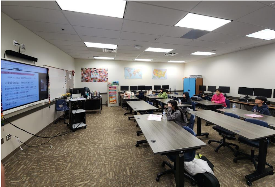
南密西根中文學校學生上課情形