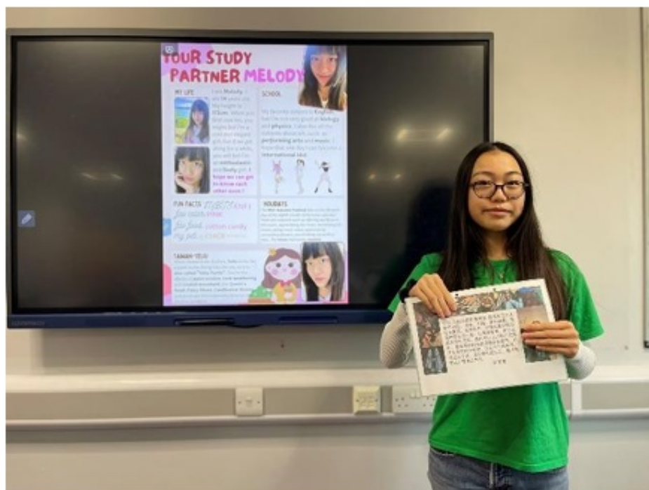
華園2024國際學伴電子海報設計交流活動5