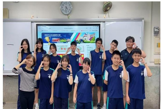
華園2024國際學伴電子海報設計交流活動1