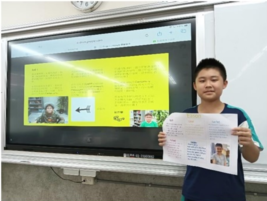
華園2024國際學伴電子海報設計交流活動2