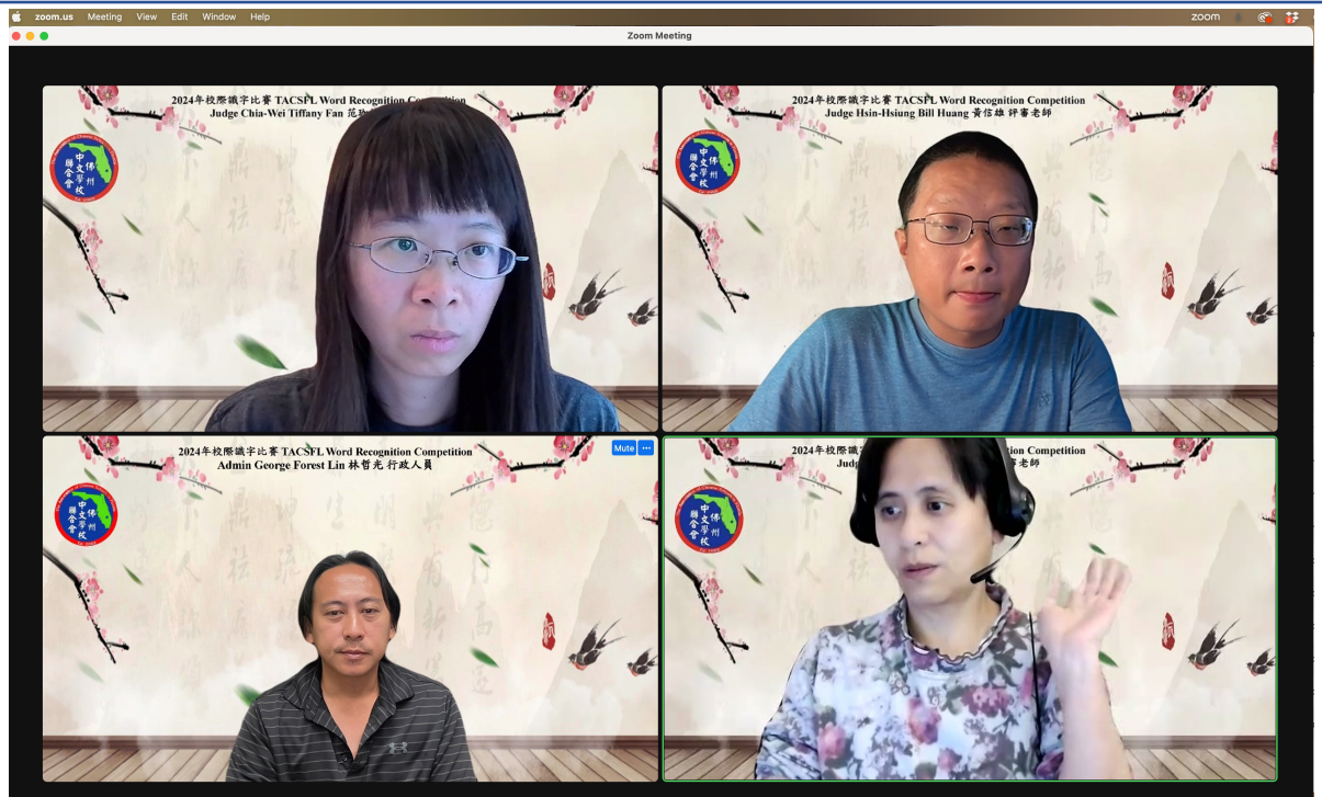
佛州中文學校聯合會識字比賽的評審老師及辛勞的工作人員