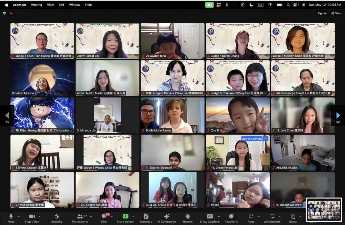
佛州中文學校聯合會 校際線上正體漢字辨認識讀比賽 參賽學生及老師合照