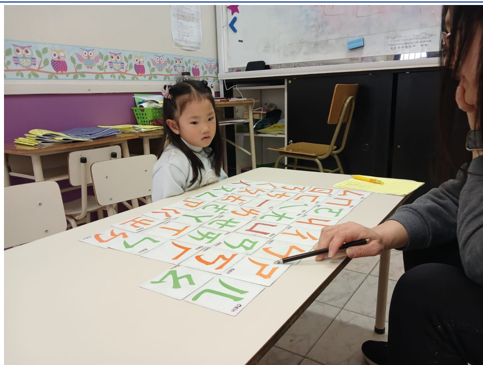
2024學年度愛育學校 正體漢字文化節 「正體漢字文化節幼兒、學前、一年級認字比賽」2