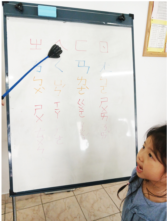
2024學年度愛育學校 正體漢字文化節 「正體漢字文化節幼兒、學前、一年級認字比賽」5