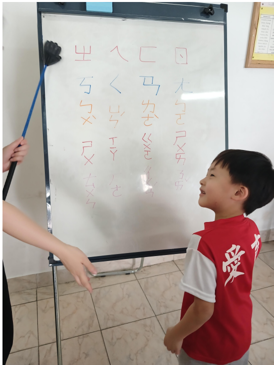
2024學年度愛育學校 正體漢字文化節 「正體漢字文化節幼兒、學前、一年級認字比賽」 3