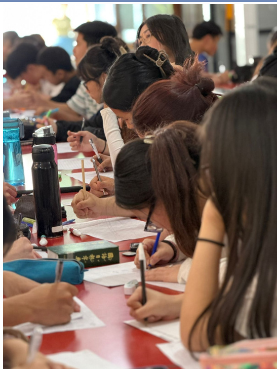
2024學年度愛育學校 正體漢字文化節「全校作文比賽」3