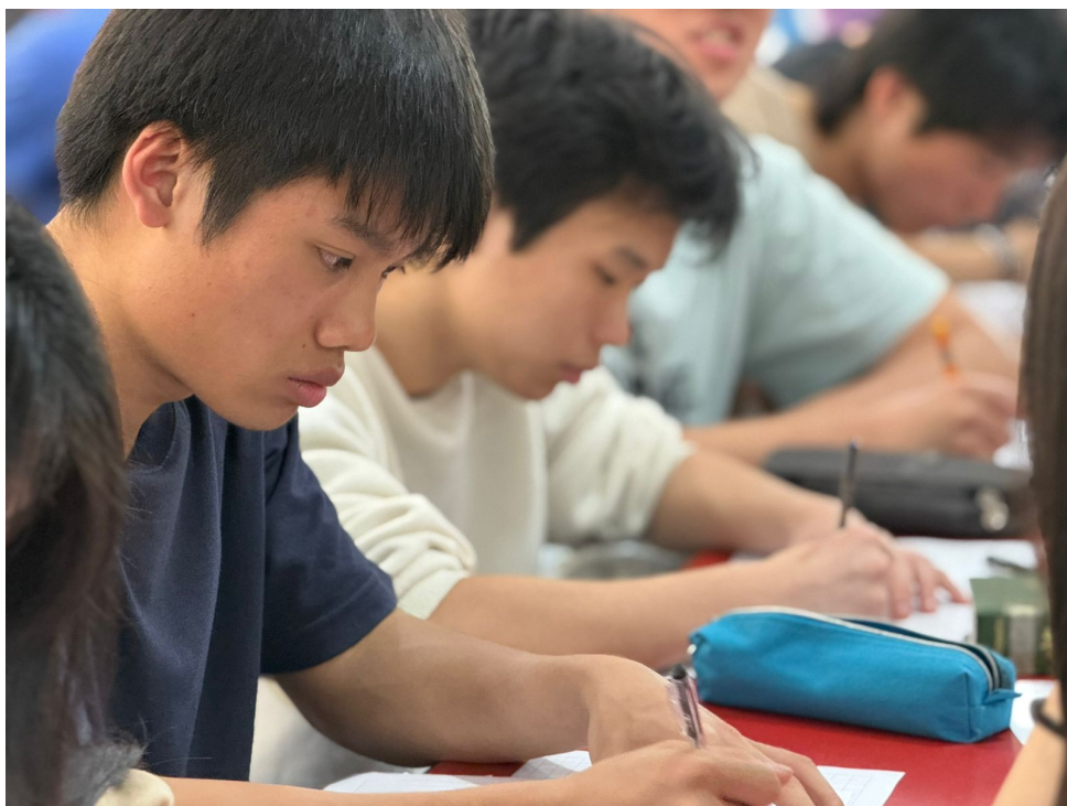
2024學年度愛育學校 正體漢字文化節「全校作文比賽」6