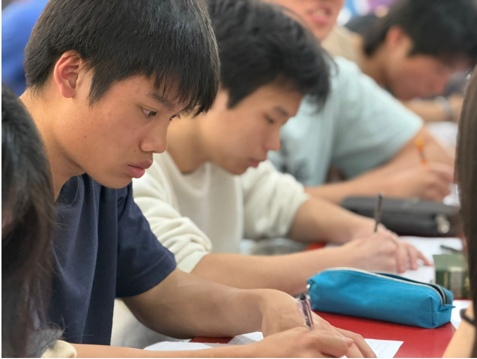
2024學年度愛育學校 正體漢字文化節「全校作文比賽」6