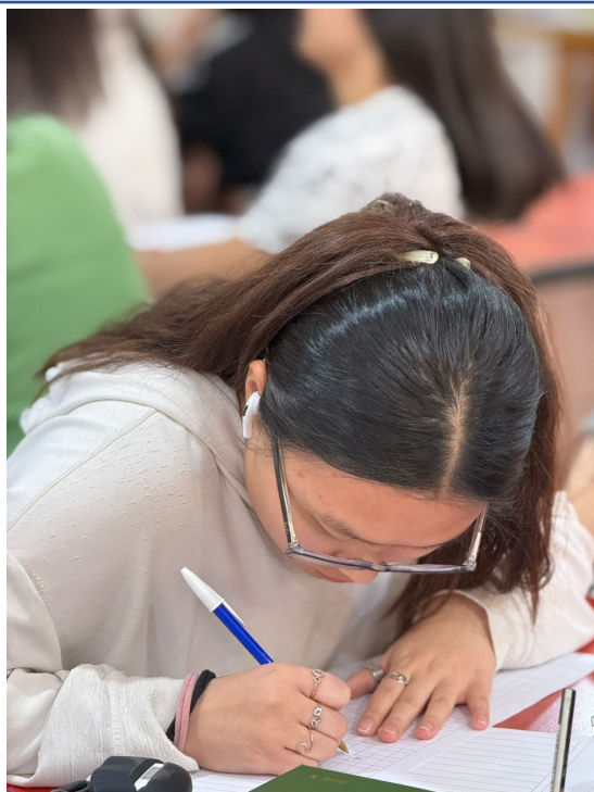
2024學年度愛育學校 正體漢字文化節「全校作文比賽」4