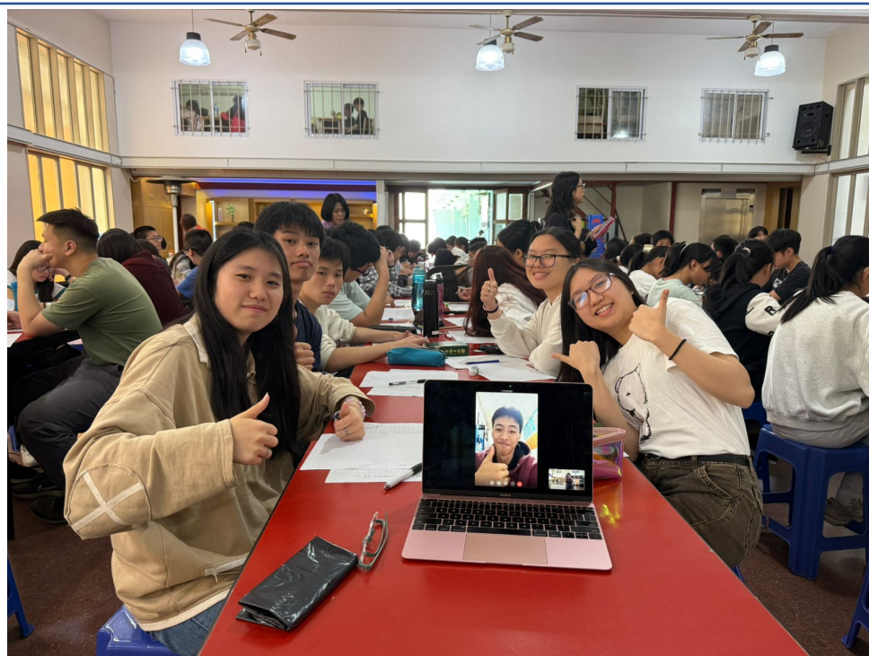
2024學年度愛育學校 正體漢字文化節「全校作文比賽」2