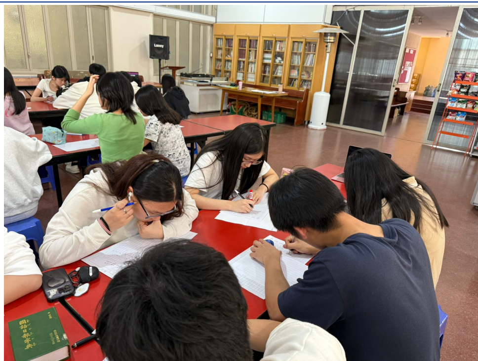
2024學年度愛育學校 正體漢字文化節「全校作文比賽」5