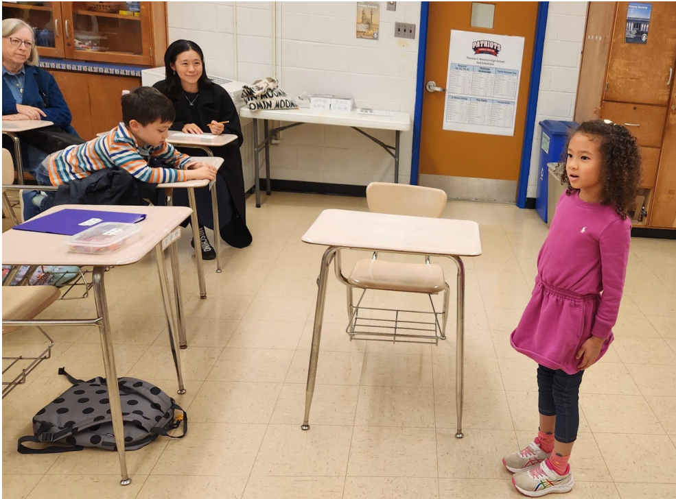
2024年華府中文學校演講比賽2