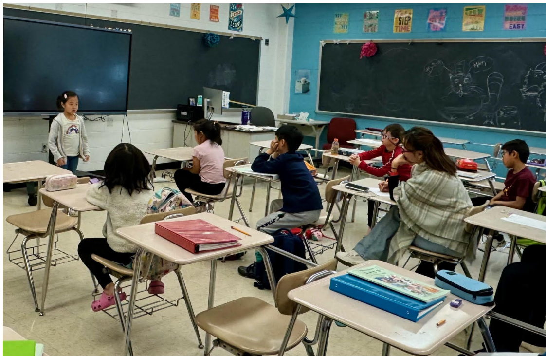
2024年華府中文學校演講比賽1

經過激烈的角逐，各班優勝學生脫穎而出，華府中文學校表示，每學期班際演講比賽不僅是對學生中文能力的檢驗，更是對他們自信心和表達能力的提升。學校也特別感謝所有參與活動的老師和家長的辛勤付出和無私奉獻，為學生們創造一個展示自我和提升能力的平臺，同時也感謝所有參賽學生，積極參與和精彩表現，為此次比賽增添許多亮點。為鼓勵所有學生繼續努力學習中文，積極參與各類文化活動，學校將於近日舉辦頒獎典禮，表揚演講比賽表現優異的學生。