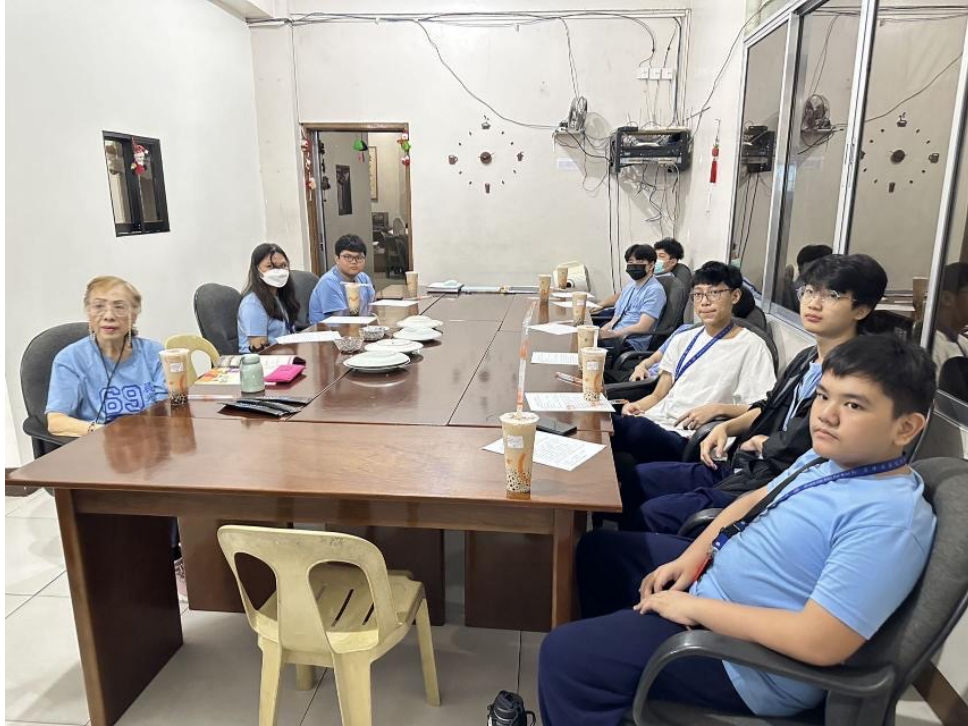
學校現場提供珍珠奶茶等臺灣經典美食，讓學生在學習華語的同時，體驗臺灣的飲食文化。