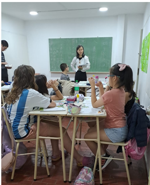
認真聽取比賽規則