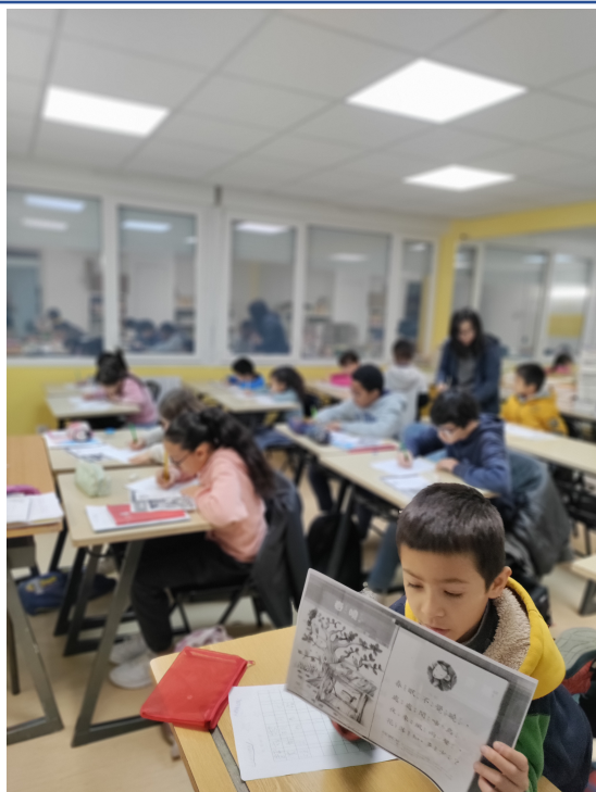
臺灣華語文學習中心-法國亭林中文學校舉辦「2024正體漢字文化節-硬筆字書寫比賽」2