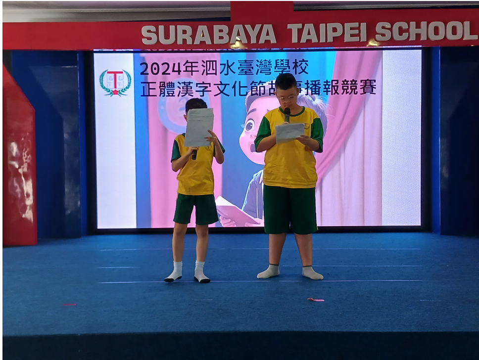
五年級2人組故事播報