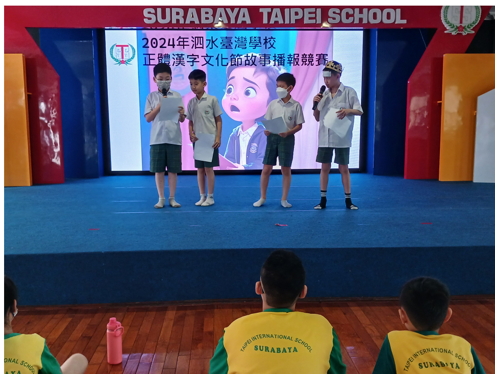
自找搭檔報名參加故事播報，過程中認真準備，值得肯定

我們藉由競賽，期待學生平時能注意：字形結構、語音聲調、語言表達的流暢、甚至是團隊合作默契。