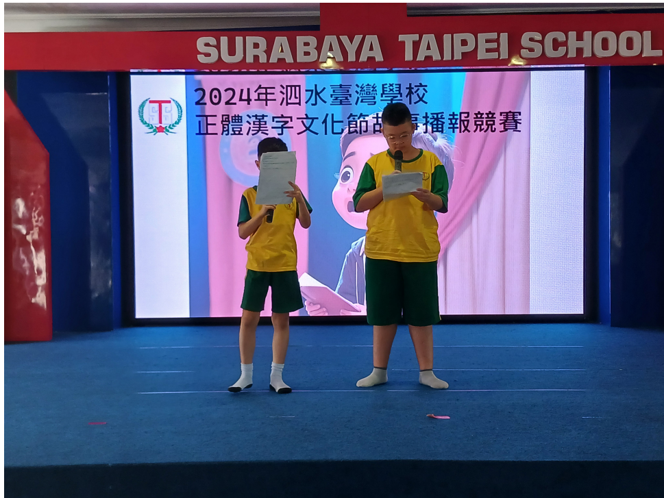
五年級2人組故事播報