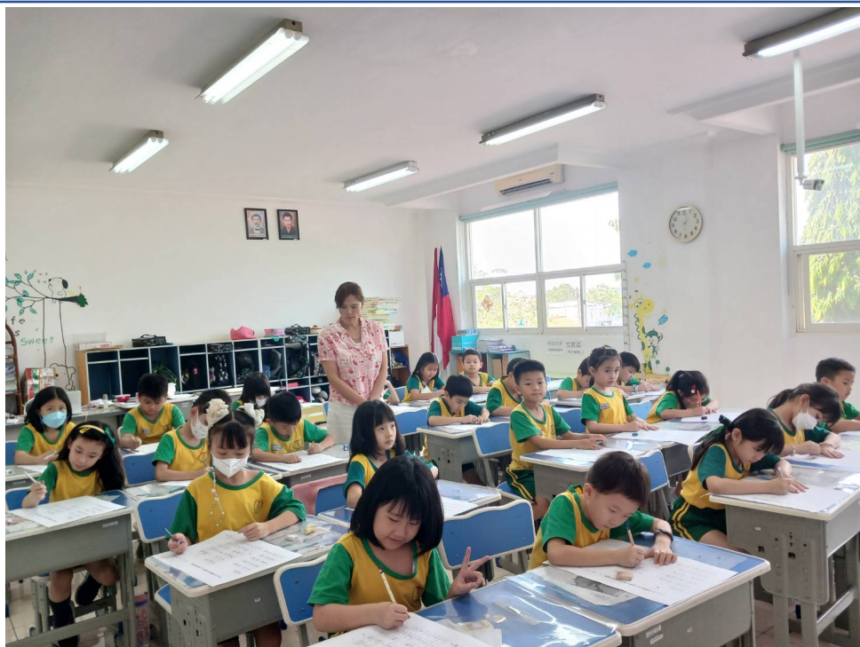
二年級硬筆字比賽，小朋友各個聚精會神，認真態度百分百