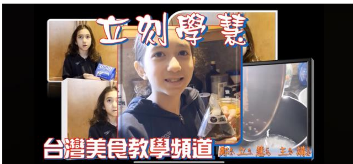
中文書院的學生用錄影的方式參加說故事比賽