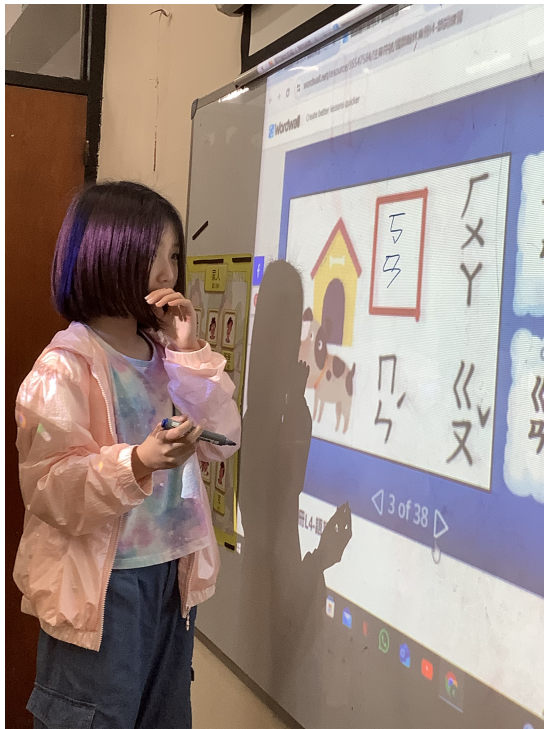
新興文教中文學校2024學前組雙拼比賽1

本校在十月底舉辦了低年級看圖說故事比賽，完後，乘勝追擊在十一月初就舉行了學前組雙拼比賽，雙拼就是注音符號中聲母加上韻母所結成的字音，必須建立在雙拼上，否則便會不知所從，故在學前班的學習重點和目標，中文字的字形，它和注音符號卻有相關的聯帶，[包]就帶有勺的符號，[巫]字除了有丩的符號外，還帶有又的符號，故將注音符號學好，就是向漢字邁前一大步的基礎。漢字有單音字，也有雙拼和三拼，進入認漢字前，拼音就是教導孩童入門的，最前哨。學習的難易就是將拼音過程有趣化，讓學生在適當的教導下，個個育教於樂，不畏學習將拼音如玩遊戲一般，而打下美好的基礎。