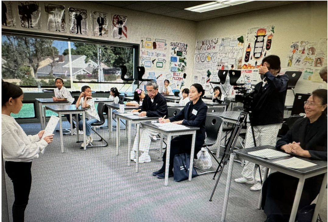
評審仔細聆聽每一位參賽者的朗讀。