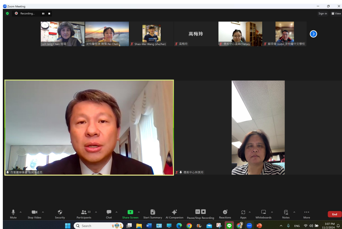
駐西雅圖台北經濟文化辦事處處長 甄國清 致詞