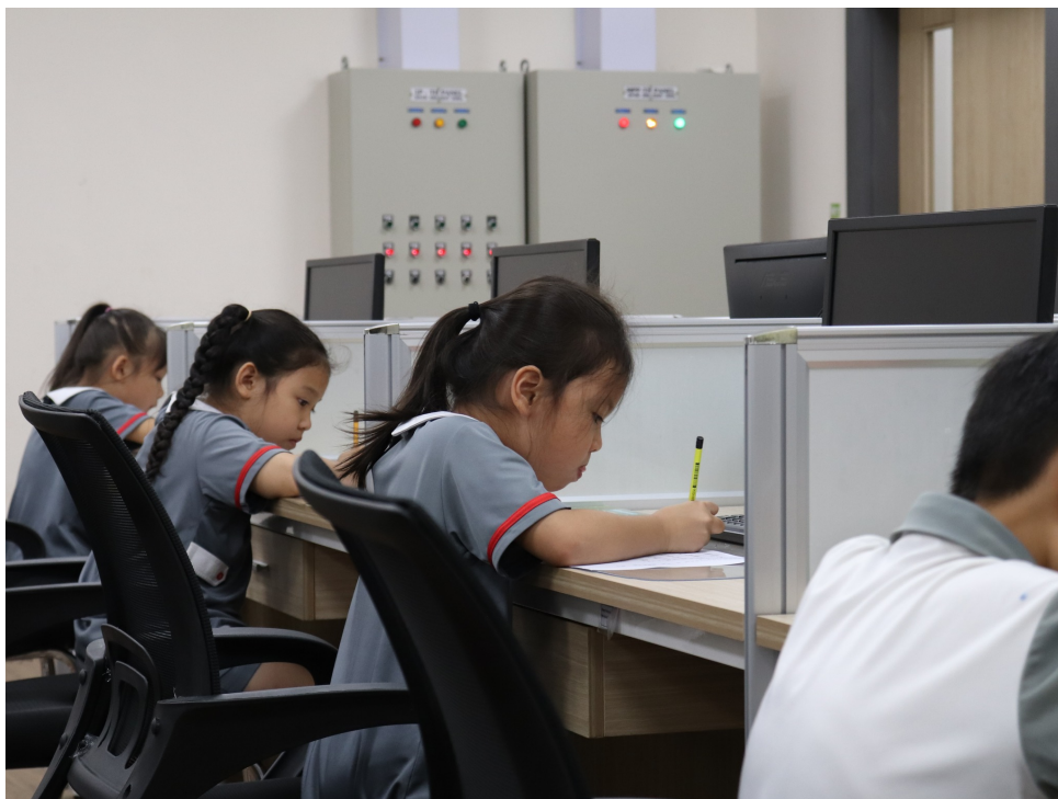
孩子專心的將文字完成。

此次競賽不僅是一場精彩的比賽，更是一次文化交流的盛會。參賽學生在書寫中體驗漢字的美，並在創作中表達自我，展現了他們對華語文學習的熱情。越華國際學校希望透過這樣的活動，進一步推動正體漢字文化的傳承與發展，培養學生的語文能力和人文素養。