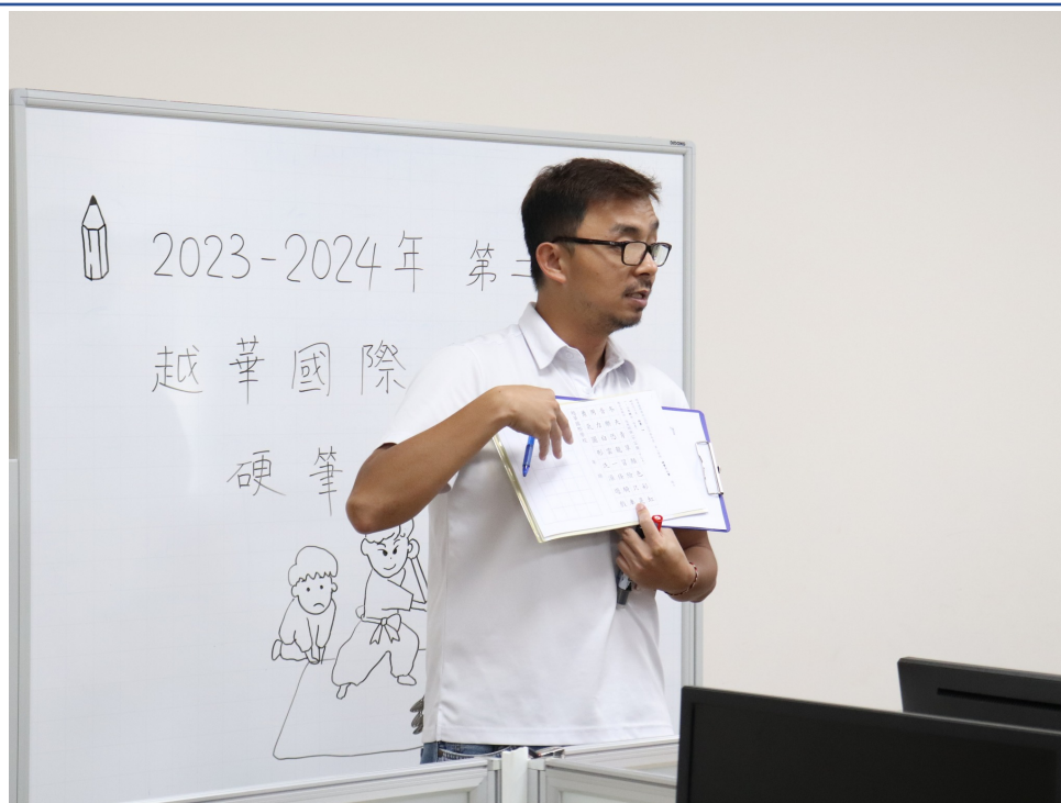
教導主任說明比賽規則與辦法